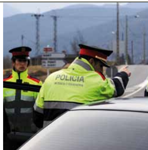
Control a la confluència de l'N-260 amb la C-14 a Adrall.

Cela posa èmfasi en la mortalitat del col·lectiu de motoristes. "Els accidents de motocicleta suposen gairebé el 50% dels morts anuals i alguns anys, com és el cas del 2005, aquesta xifra ha estat del 52%. Dels 17 morts registrats, nou eren usuaris de motocicletes. Per aquest motiu, del mes de juny al mes de setembre, i també alguns caps de setmana en els quals es preveu l'afluència de motocicletes, es fan controls preventius adreçats a conscienciar els motoristes", va comentar. Aquest dispositiu, Premot, es fa en col·laboració i coordinació amb la resta d'efectius de la regió policial: unitats de seguretat ciutadana, serveis regionals i Servei Català de Trànsit.