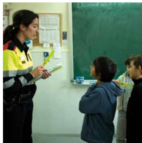
Taller de mobilitat segura a l'escola del Pla de Sant Tirs.