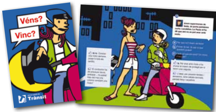
Díptic del material "Véns? Vinc?".