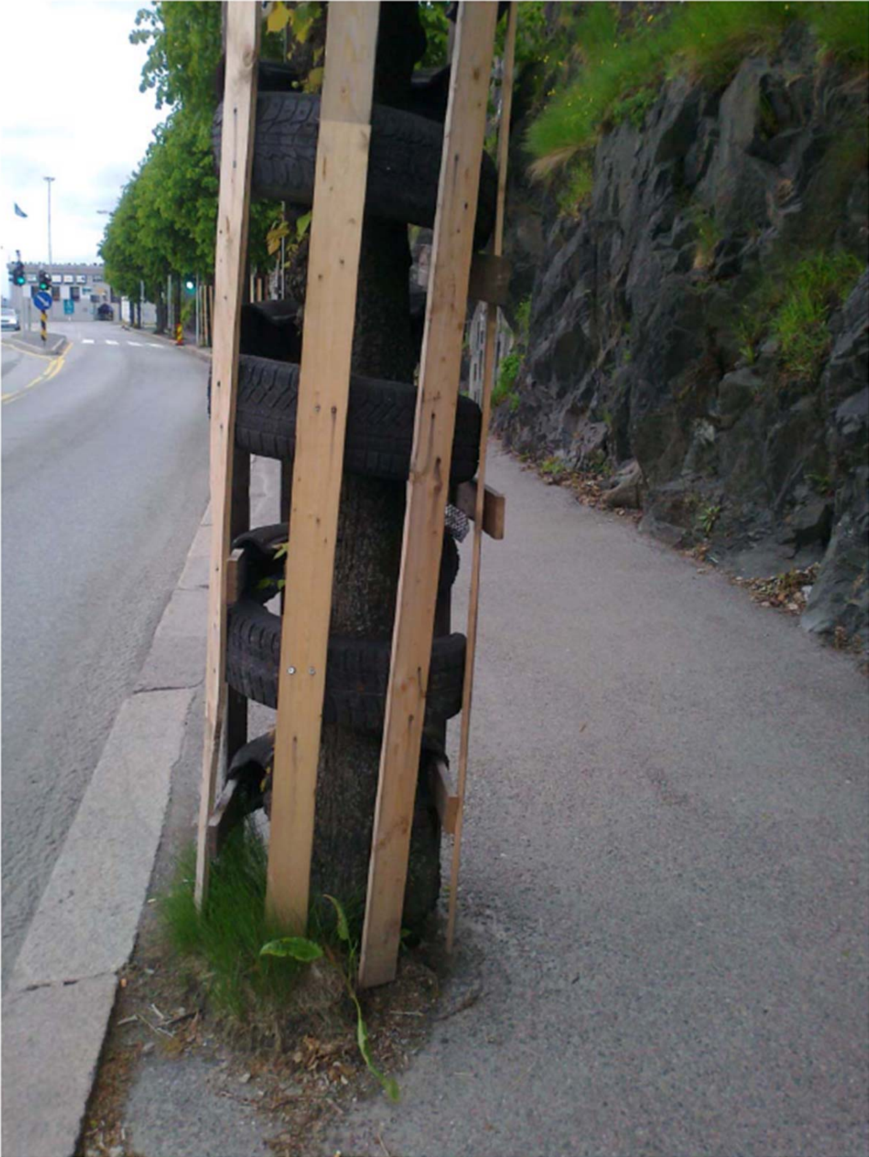
Bergen - Noruega