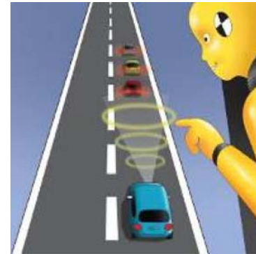
Frenada de emergencia