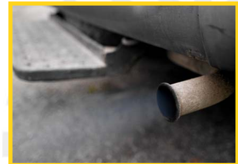
Emissions de CO2