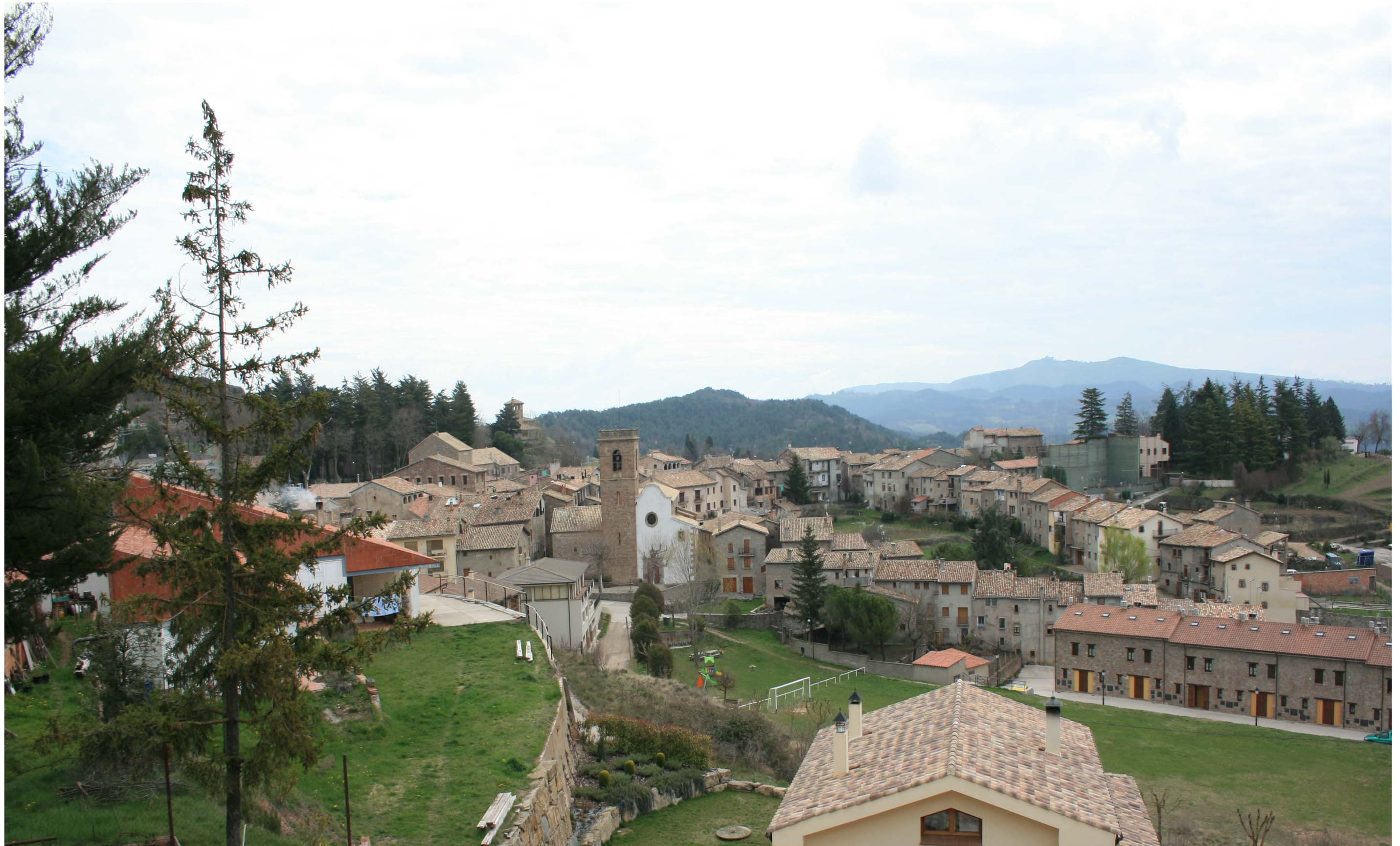
Figura 11.8. Els nous sectors urbanitzats d'Alpens s'integren en el context paisatgístic del poble. Alt Ter.