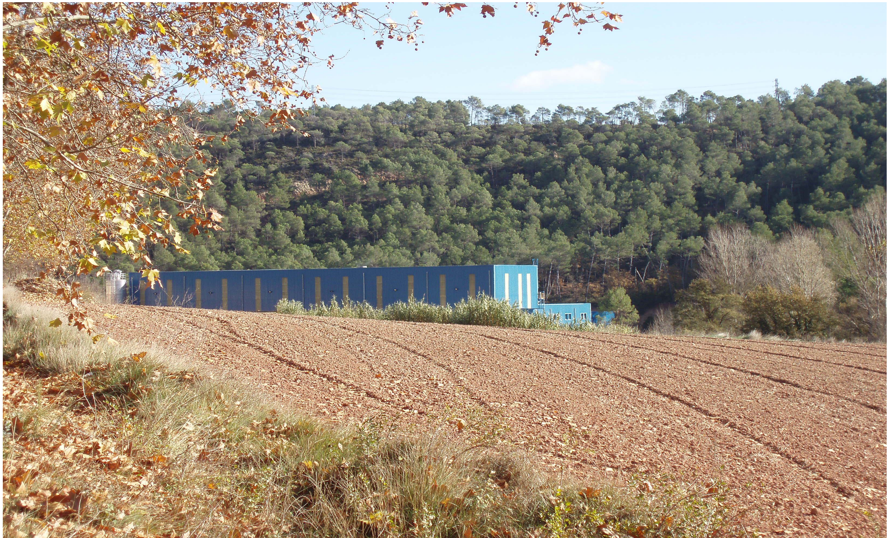
Figura 11.4 Indústria estratègicament ubicada, amb poc impacte visual. Carne. Valls de l'Anoia.