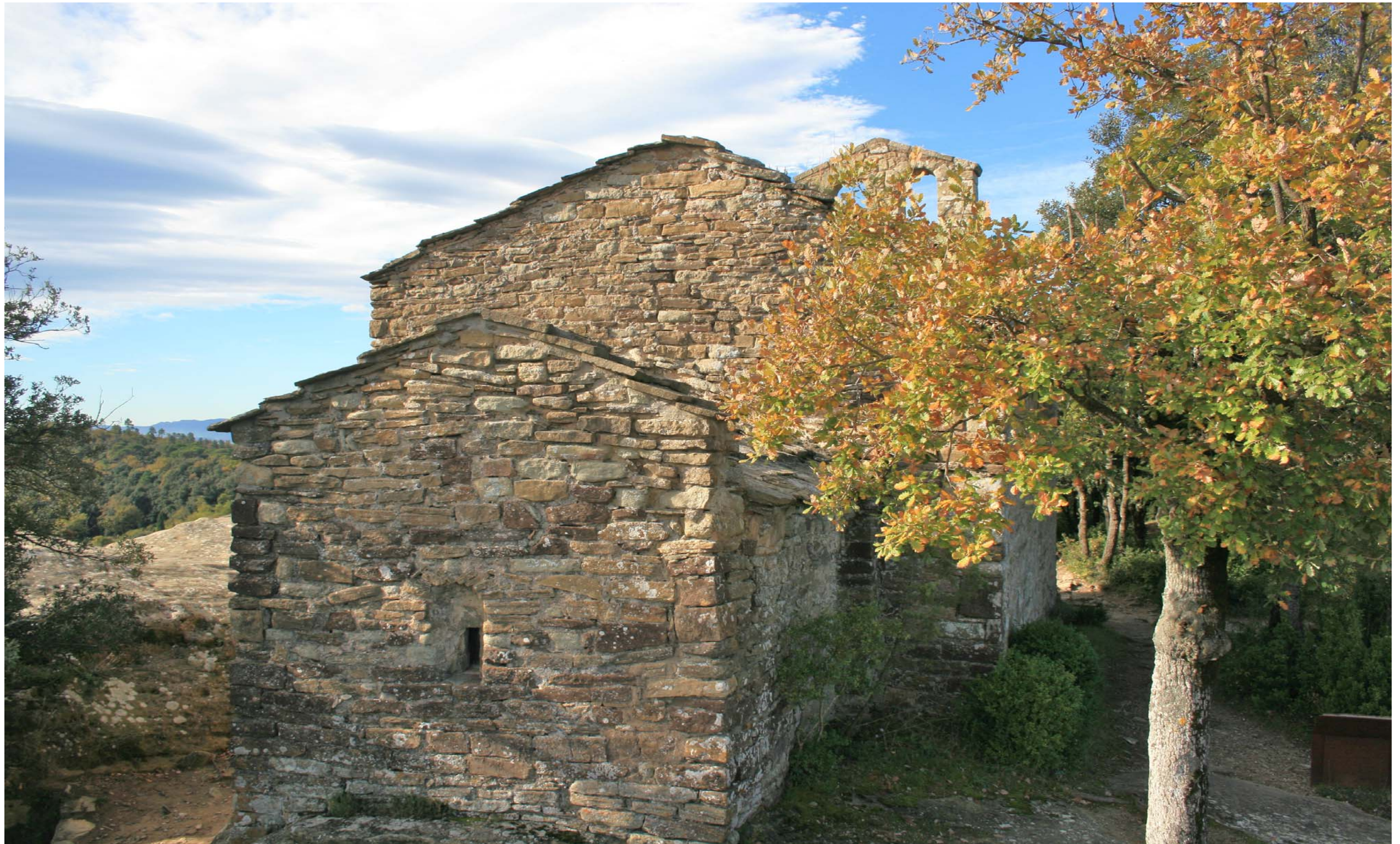
Figura 11.9. Sant Feliu de Savassona. Tavèrnoles. Cabrerès-Puigsacalm.