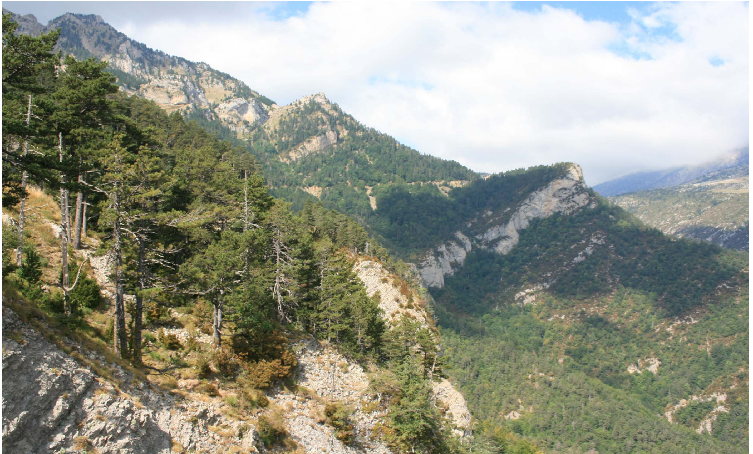
Figura 11.10. El Roc del Pi Ajagut. Saldes. Capçaleres del Llobregat.