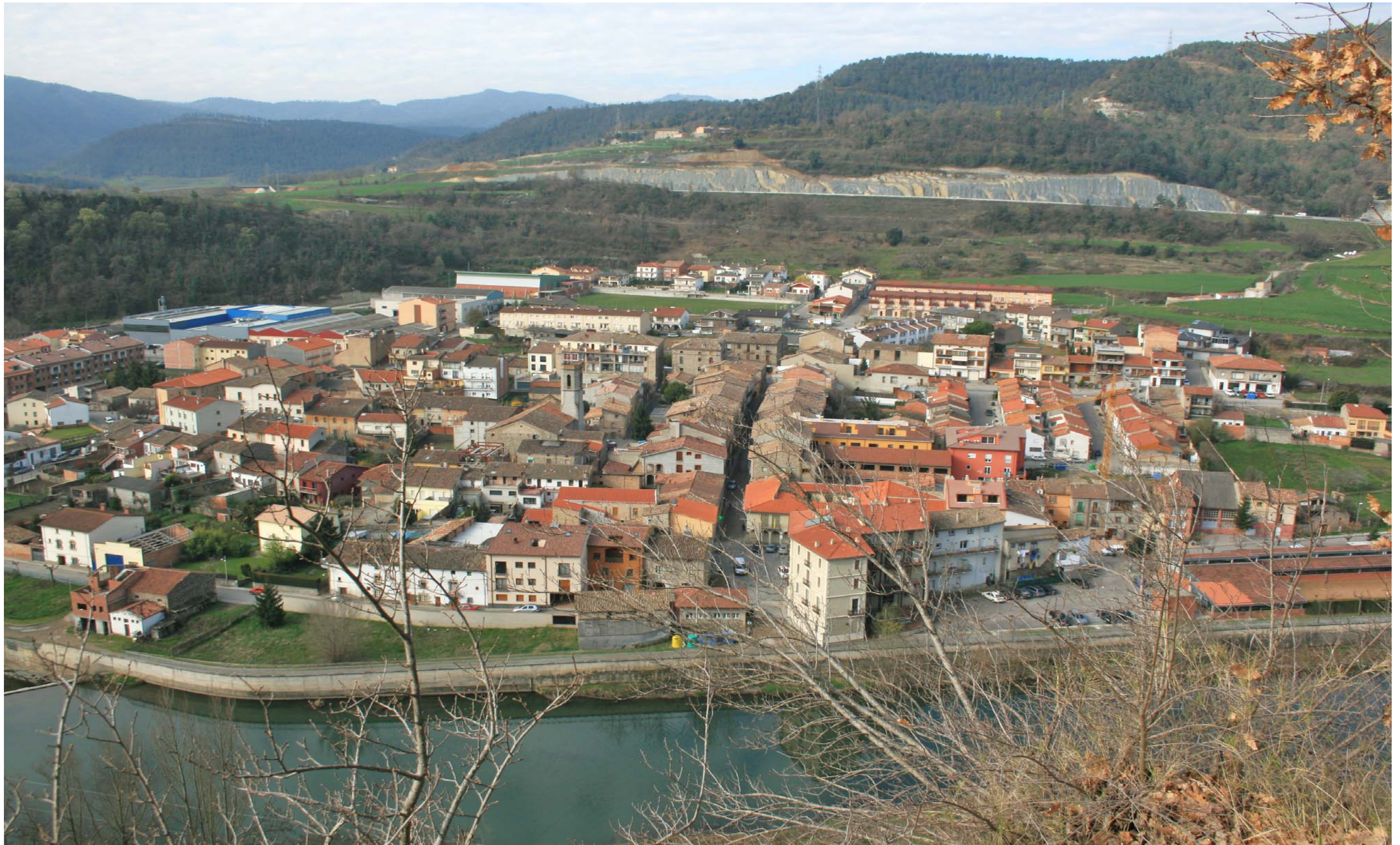
Figura 11.2. Montesquiú, exemple de nucli agrupat amb perímetre nítid. Alt Ter.