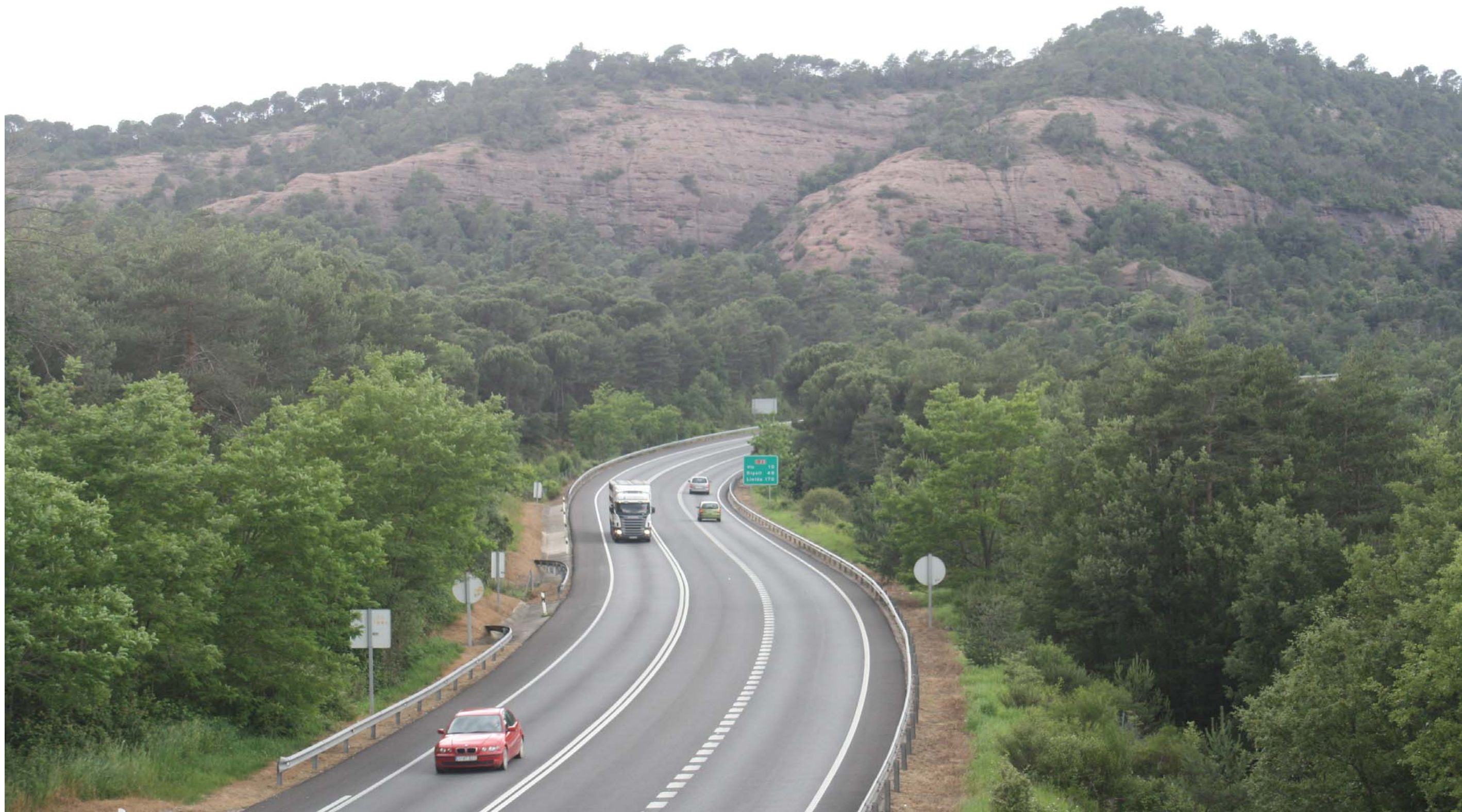
Figura 11.3. L'Eix Transversal (C-25) al seu pas per Romegats. Guillerics.