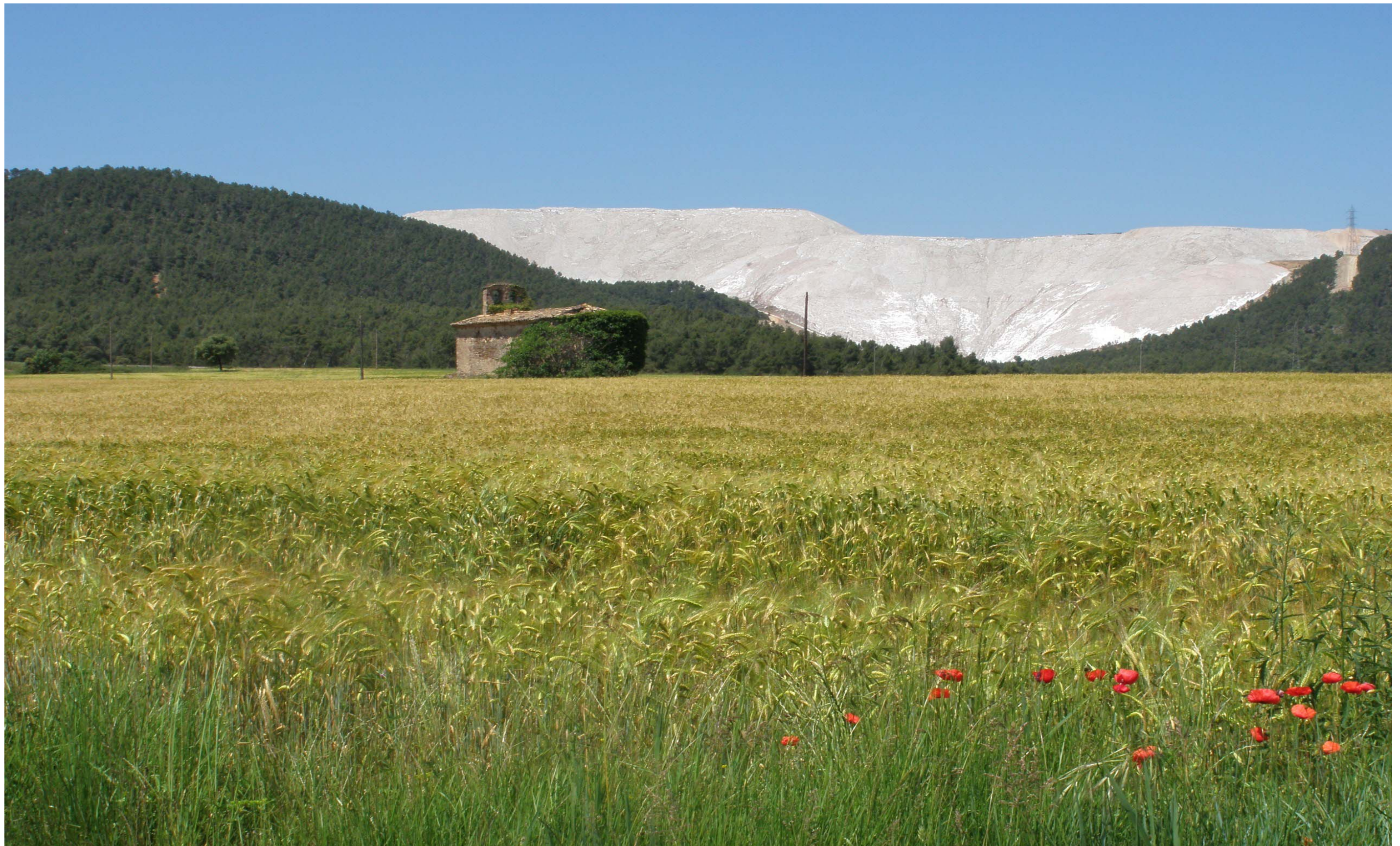
Figura 11.5. Els runams són un dels elements que configuren els paisatges miners. Runam salí a Sallent. Conca Salina.