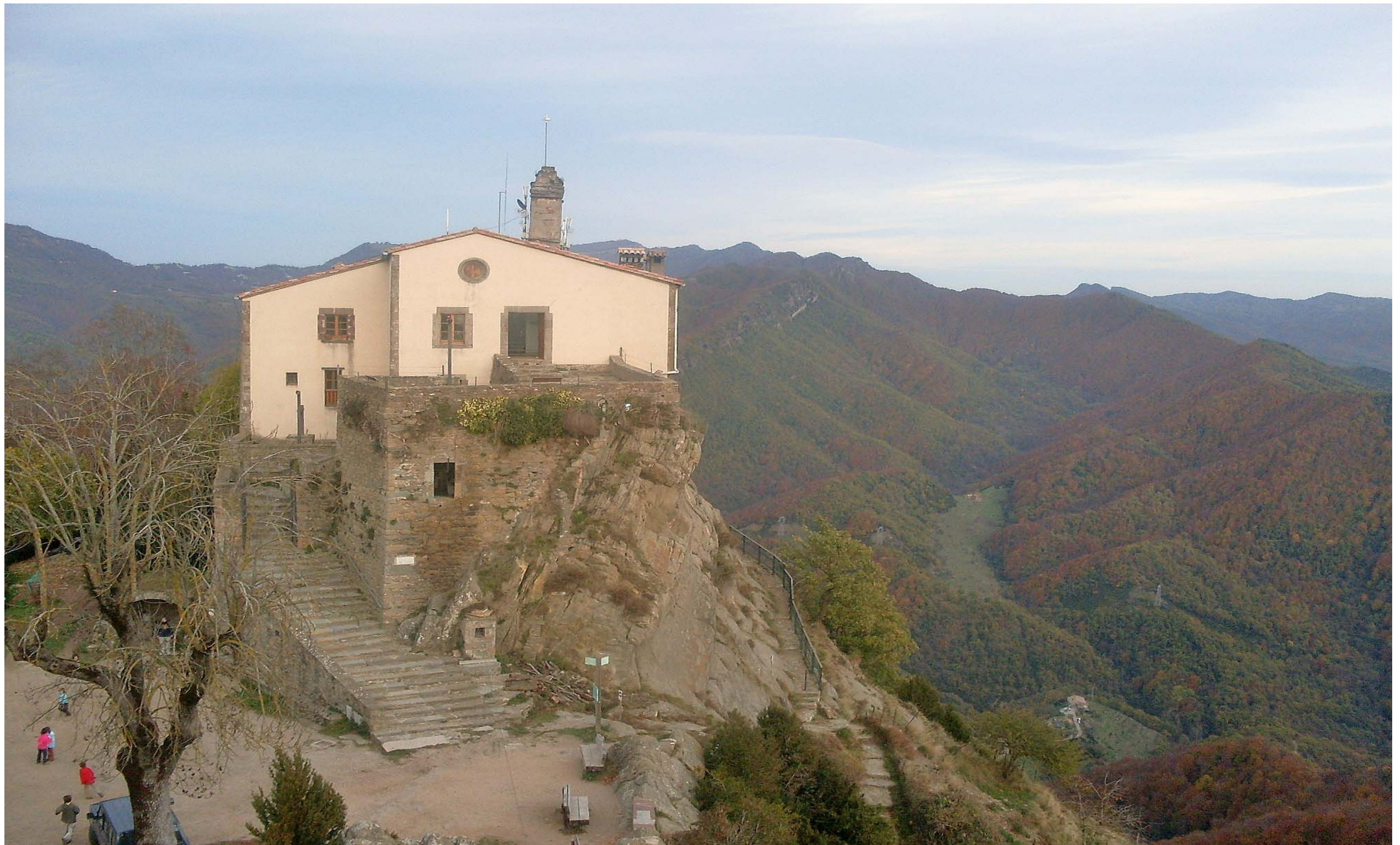
Figura 11.12. El santuari de Bellmunt. Sant Pere de Torelló. Cabrerès-Puigsacalm.