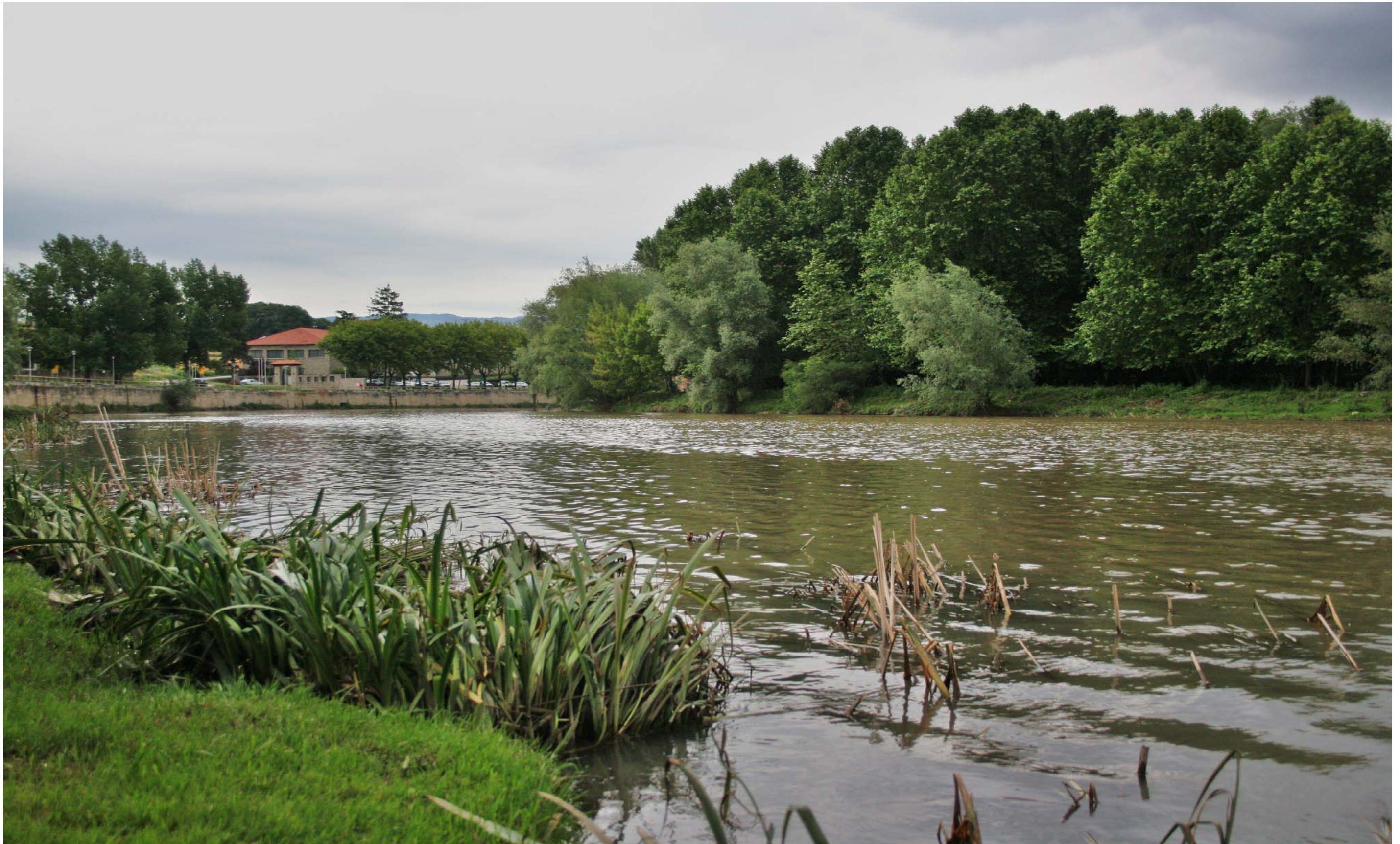
Figura 11.7. El Ter al seu pas per Manlleu. Plana de Vic.