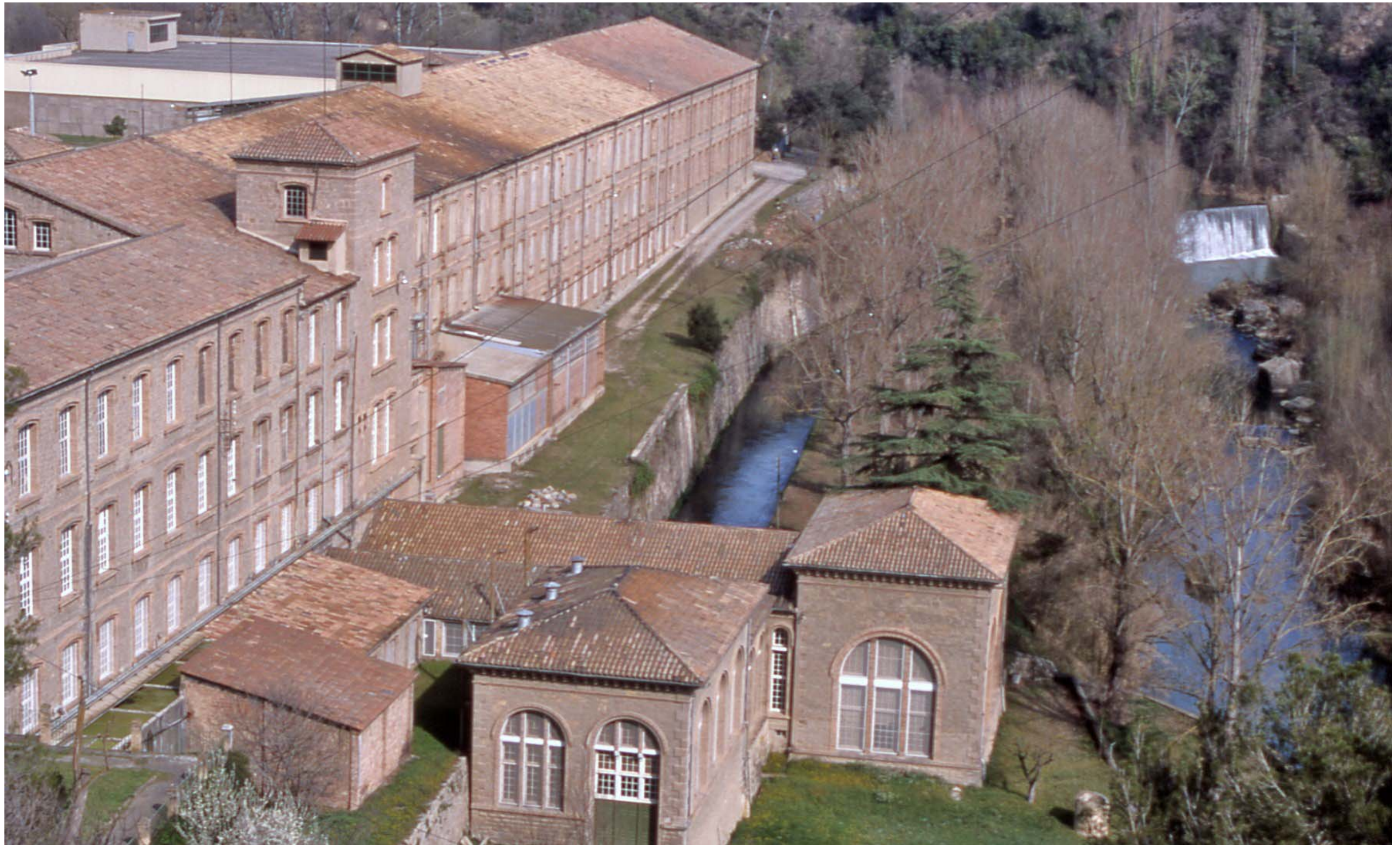
Figura 11.6. Cal Marçal, exemple de colònia tèxtil a la riba del Llobregat. Puig-reig. Replans del Berguedà.