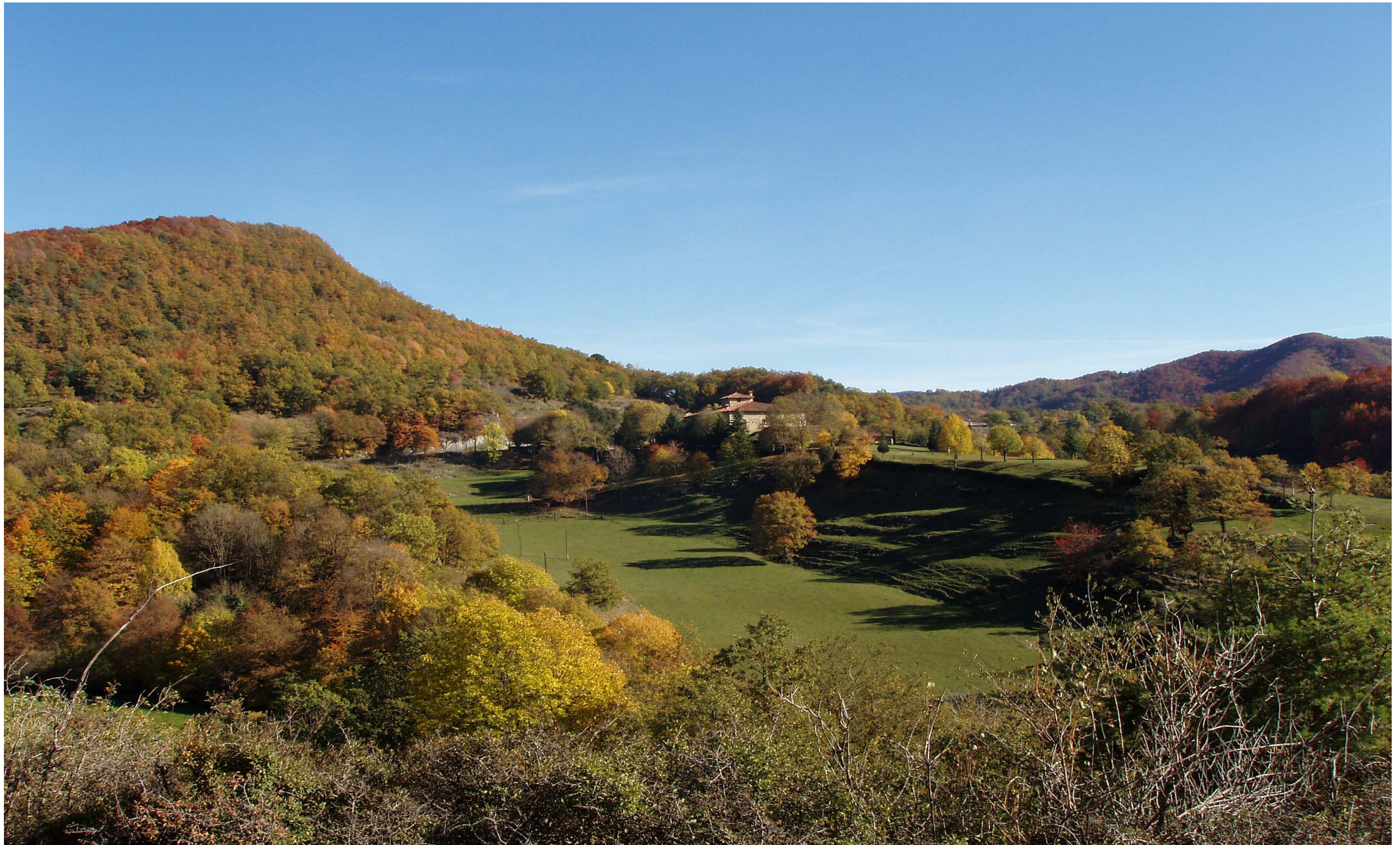
Figura 11.11. Paisatge agroforestal a Vidrà. Cabrerès-Puigsacalm.