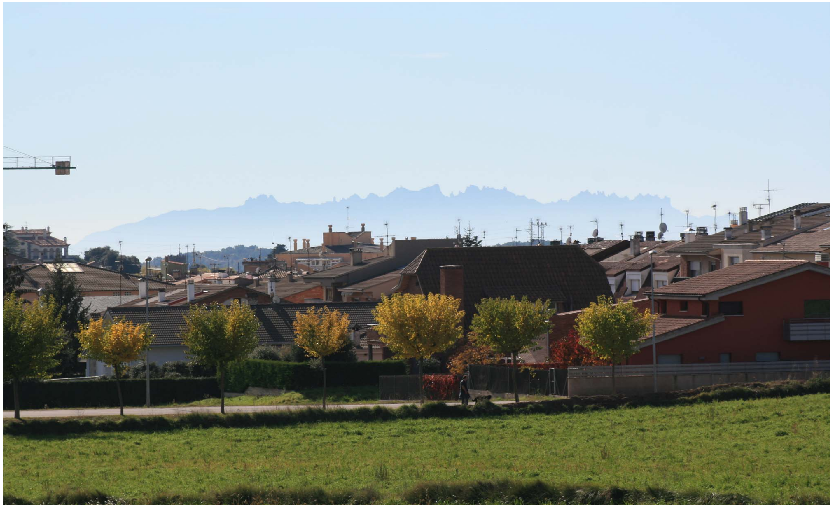
Figura 11.13. Prats de Lluçanès, amb Montserrat com a fons escènic. Lluçanès.