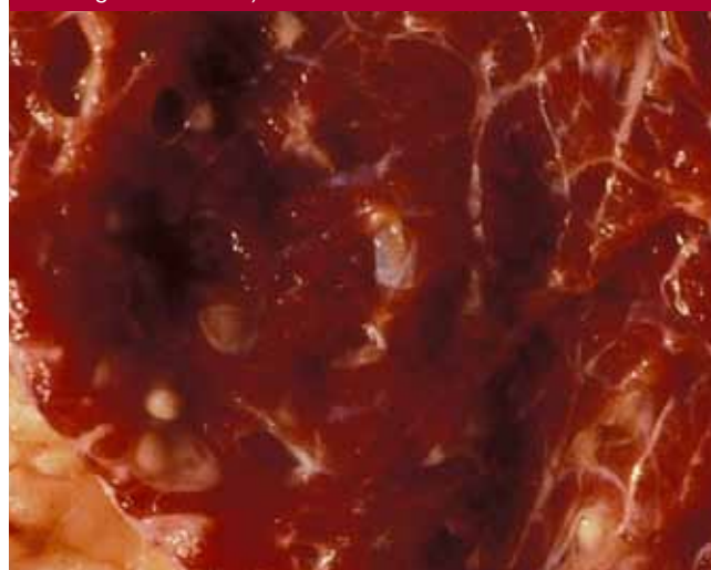
Figura 2. Quists en múscul.

d'animals positius amb aquesta tècnica serològica i comparar-lo amb el percentatge d'animals detectats per inspecció visual en animals de menys de 24 mesos criats i sacrificats a Catalunya.