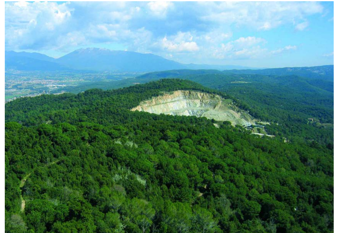
Pedrera a Òrrius (Maresme). M. Guardiola

Per tot el territori, llevat de l'alta muntanya.