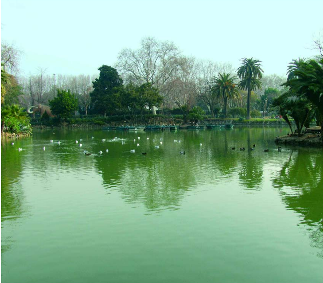
Parc de la Ciutadella, Barcelona. A. Petit