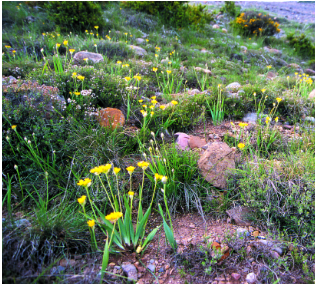
Comunitat d' Allium moly prop de Santa Engràcia (Pallars Jussà). X. Font

Codines amb caragoles ( Erodium rupestre , E. glandulosum ), Arenaria aggregata , Allium senescens ..., en terrenys calcaris o conglomeràtics, a la muntanya mitjana poc plujosa i a les serres catalanídiques