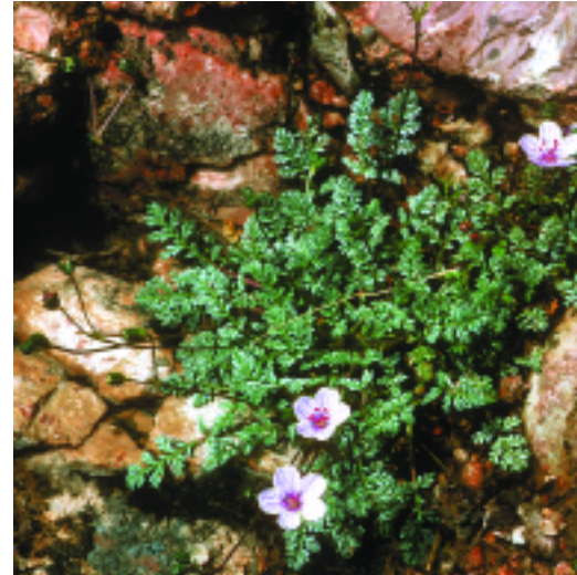
Caragola ( Erodium rupestre ). X. Font

Prepirineus i territori catalanídic septentrional i central.