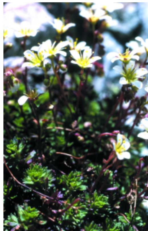
Saxifraga praetermissa . R.M. Masalles