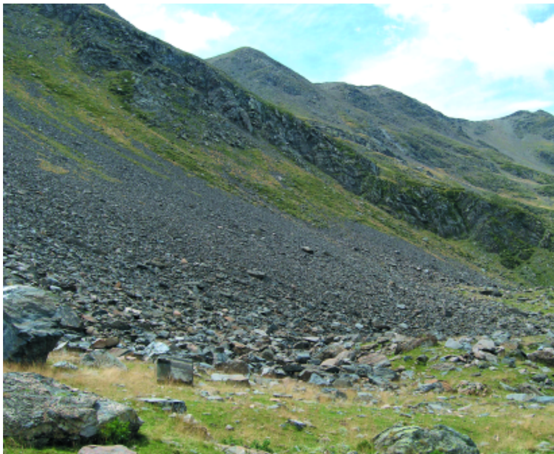
Pedrusques calcàries a l'obaga del tossal d'Astell (vall Fosca). A. Ferré

Pedrusques i clapers calcaris, amb Saxifraga praetermissa ..., d'indrets llargament innivats de l'alta muntanya