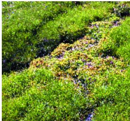
Font d'aigua dura a Filià (vall Fosca). E. Carrillo