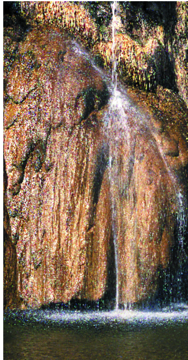
Formacions de tosca al barranc de les Costes (Alt Urgell). A. Ferré