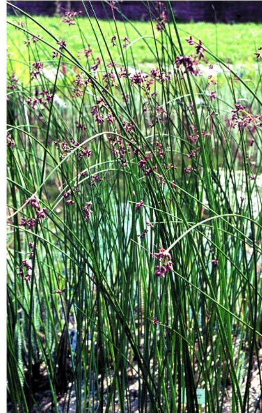
Jonca d'estany. X. Llimona

Territoris ruscínic, catalanídic, ausosegàrric i sicòric.