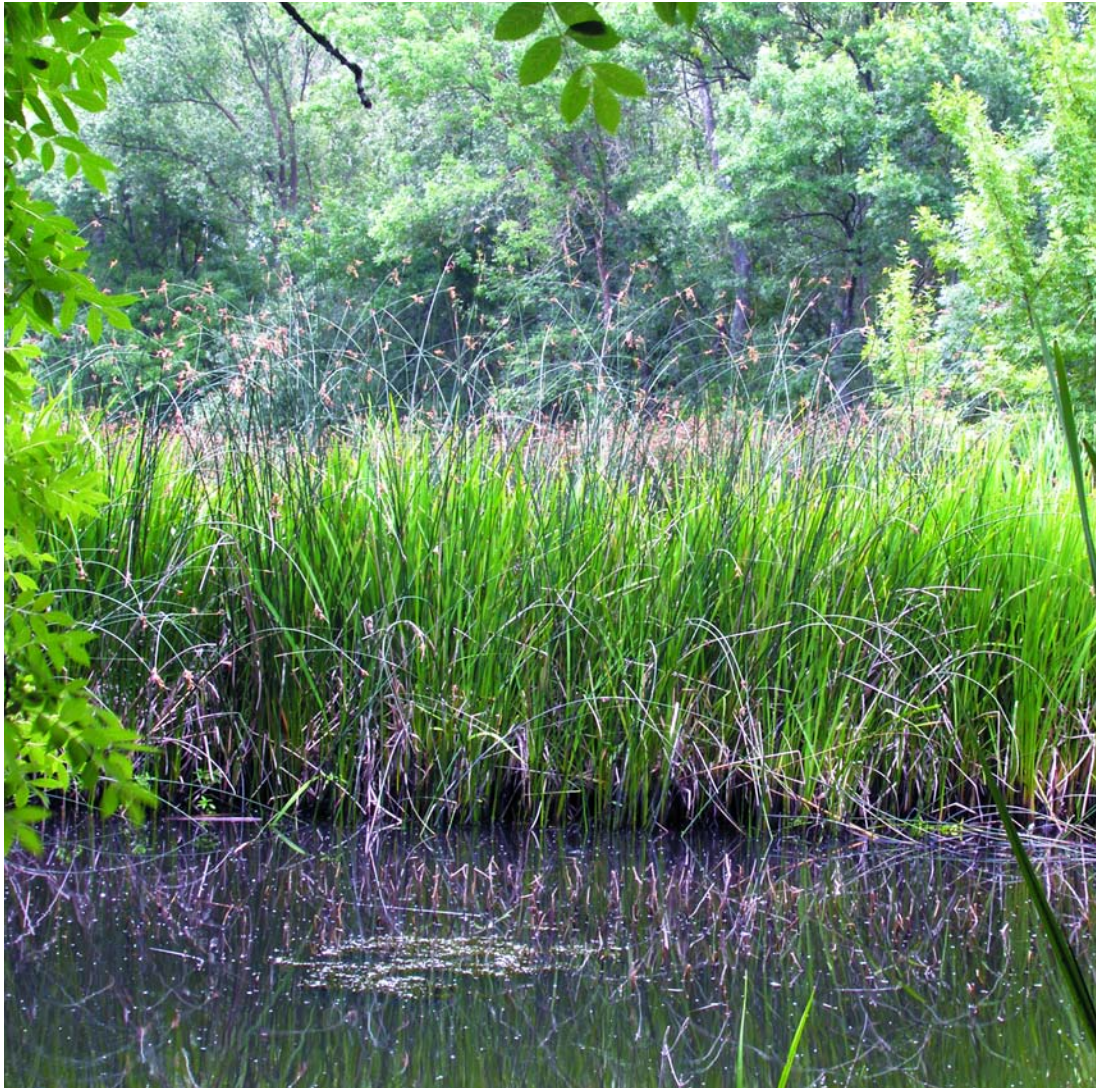
Herbassar de jonca d'estany i balques a l'estany de Tordera (Maresme). A. Ferré