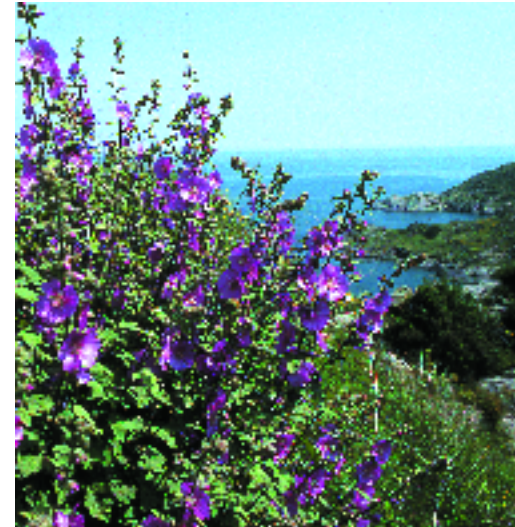
Lavatera olbia. X. Font

Territoris ruscínic i catalanídic septentrional (i central).