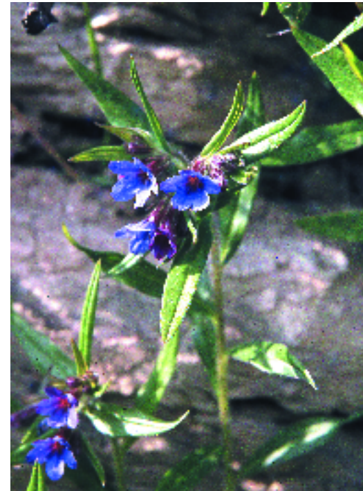
Mill gruà. J. Carreras

Territoris catalanídics, ausosegàrric i sicòric (i Prepirineus).