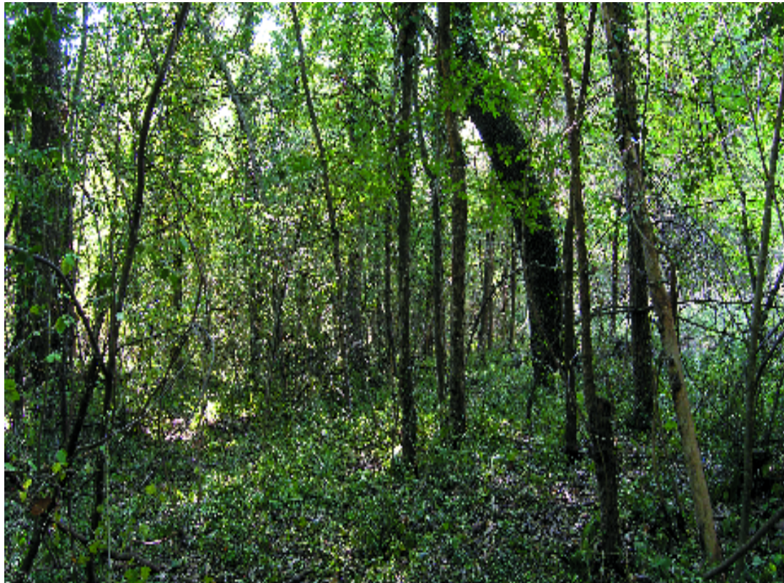
Omeda a la riera de Carne (Añoia). A. Ferré