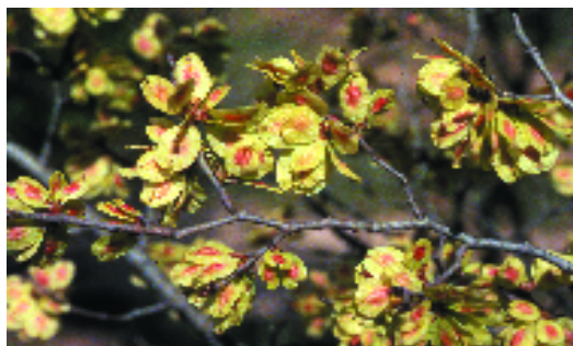
Om en fruit. R.M. Masalles