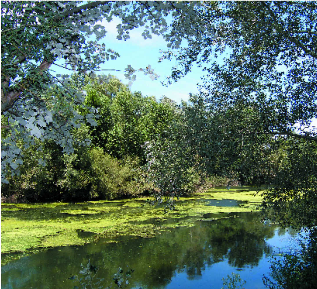
Alberedes de la Muga, a Castelló d'Empúries (Alt Empordà). A. Ferré

Alberedes (i pollancredes) amb lliri pudent ( Iris foetidissima ), del territori ruscínic i dels Prepirineus centrals