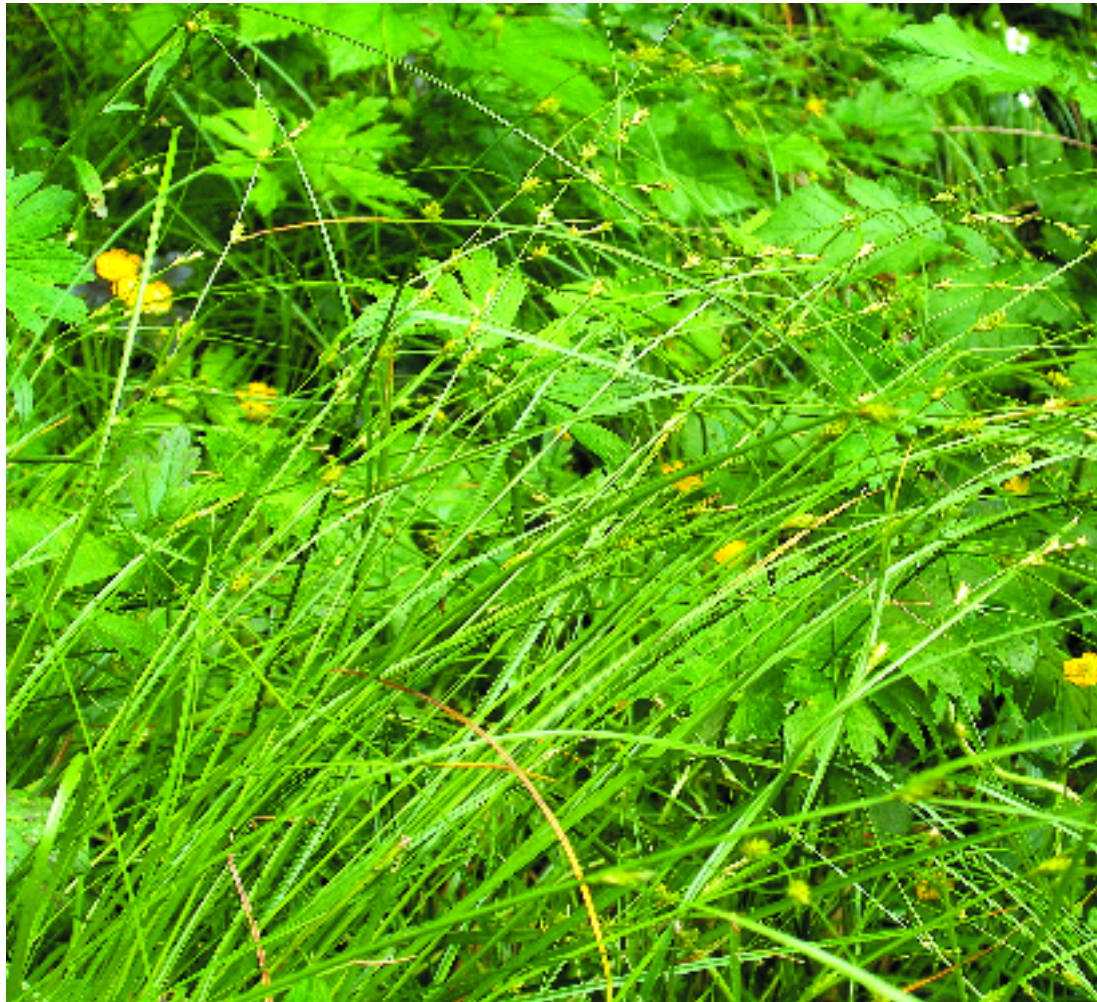
Carex remota . A. Ferré i J. Vigo

Vernedes amb Carex remota , que es fan a tocar de l'aigua o en sòls molt xops, a la muntanya mitjana pirinenca i al territori catalanídic septentrional