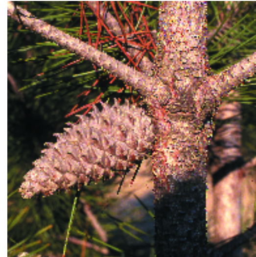
Pinastre. L. Vilar

Sobretot al territori catalanídic septentrional; penetra al territori ruscínic, a l'aussegàrric i al catalanídic central.