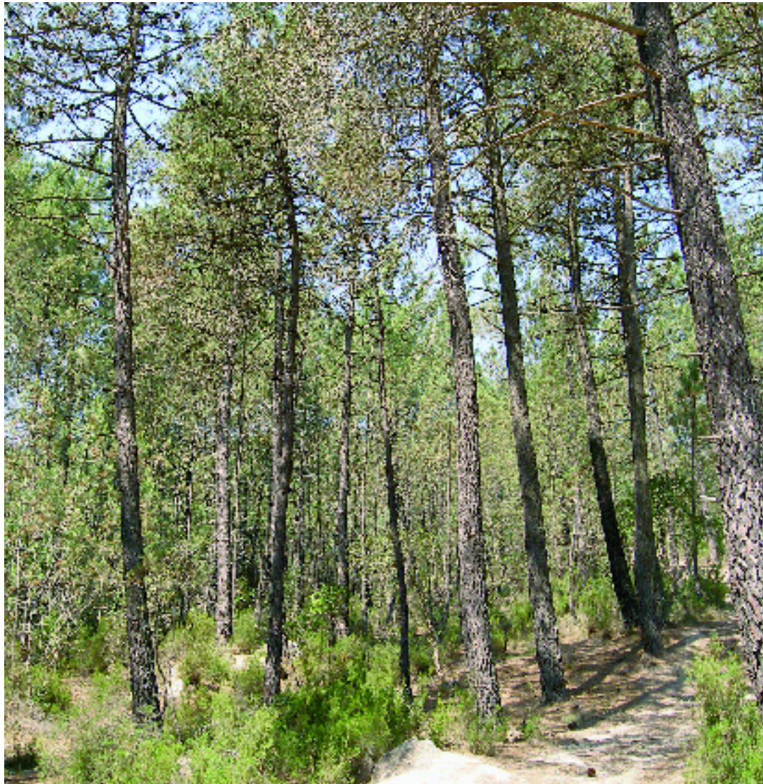
Pineda de pinastre a les Gavarres. A. Ferré

Pinedes de pinastre ( Pinus pinaster ), amb sotabosc de brolles o de bosquines acidòfiles, de la terra baixa catalana