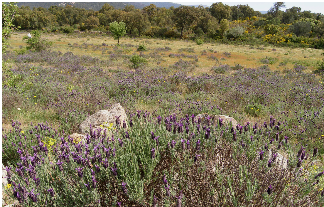
Matollar de tomaní vora els estanys de Canadal (Alt Empordà). A. Ferré i J. Vigo