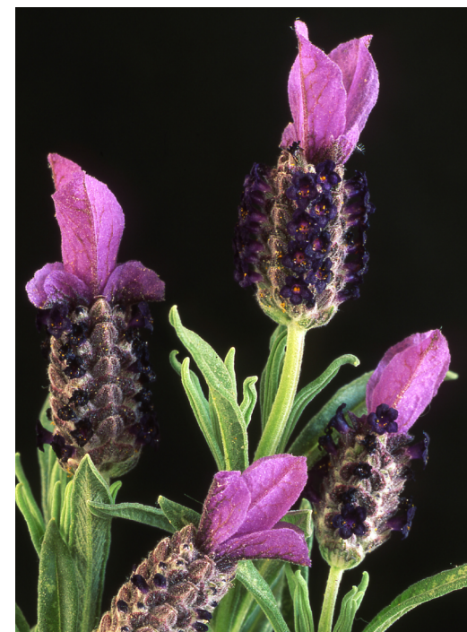
Tomaní. J. Llistosella