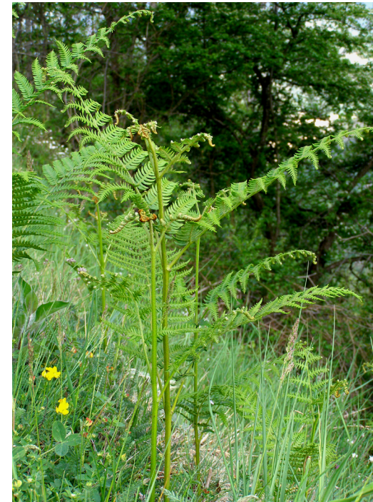
Falguera comuna. J. Vigo