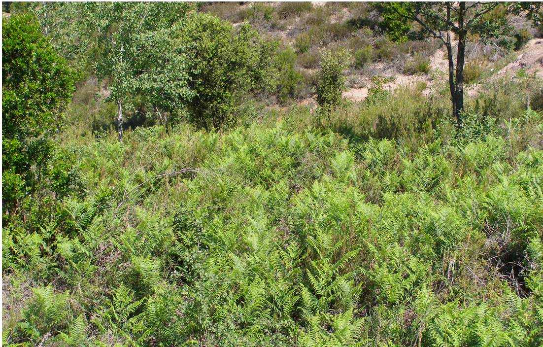
Falgar sobre Taradell (Osona). J. Vigo