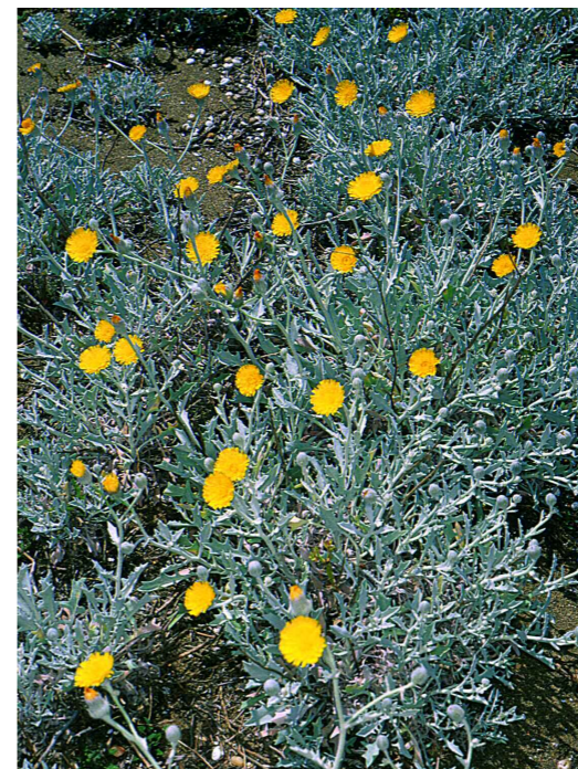
Llonja. X. Font

Andryaetum ragusinae Br.-Bl. et O. Bolòs 1957