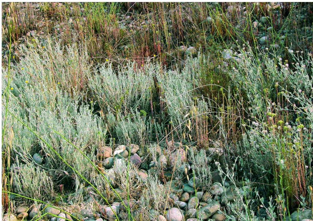
Poblament de llonja a les vores de la Noguera Ribagorçana. J.A. Conesa

Comunitats obertes de llonja ( Andryala ragusina ), cascall marí ( Glaucium flavum )..., de codolars de rambles i rieres de terra baixa (i de la muntanya mitjana)