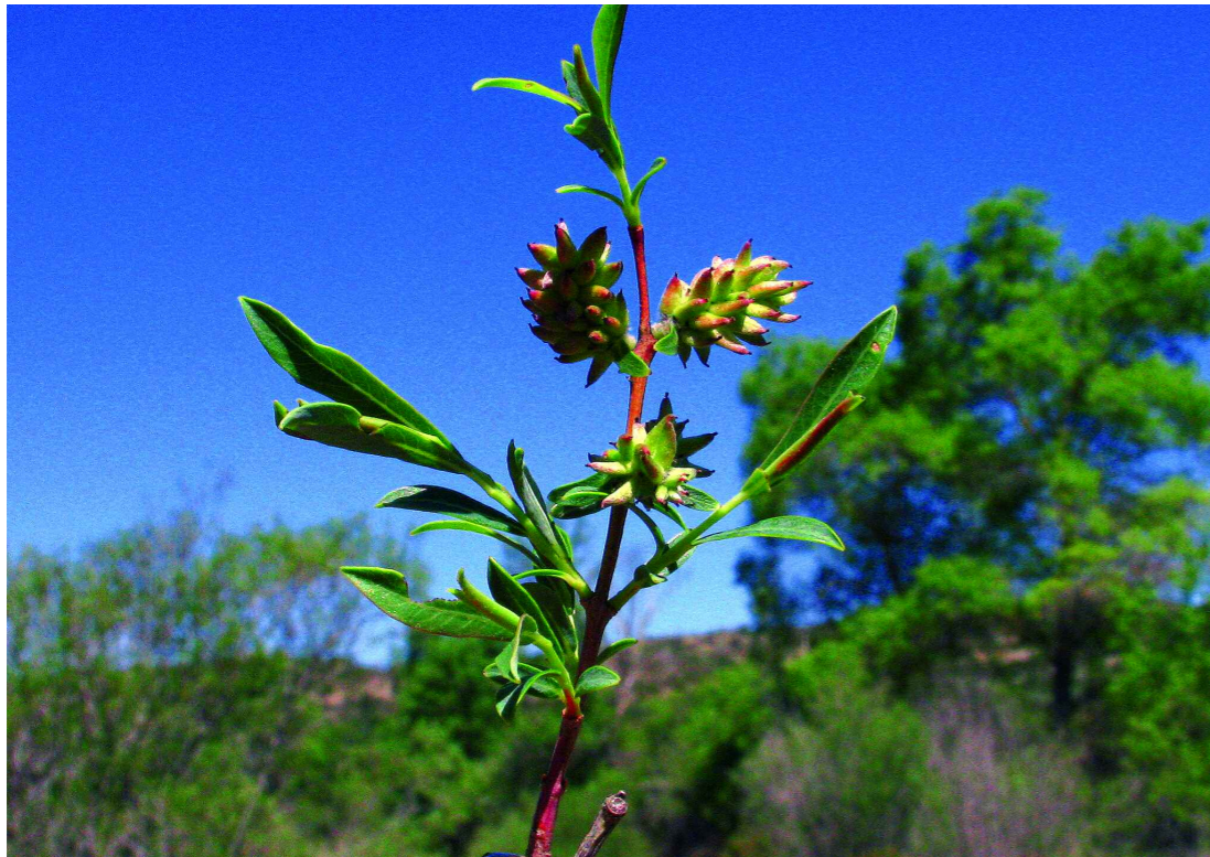
Sàlic. J.L. Benito

Bosquines de salzes ( Salix spp.), verns ( Alnus glutinosa ), bedolls ( Betula pendula )..., de codolars de torrents, a l'estatge montà