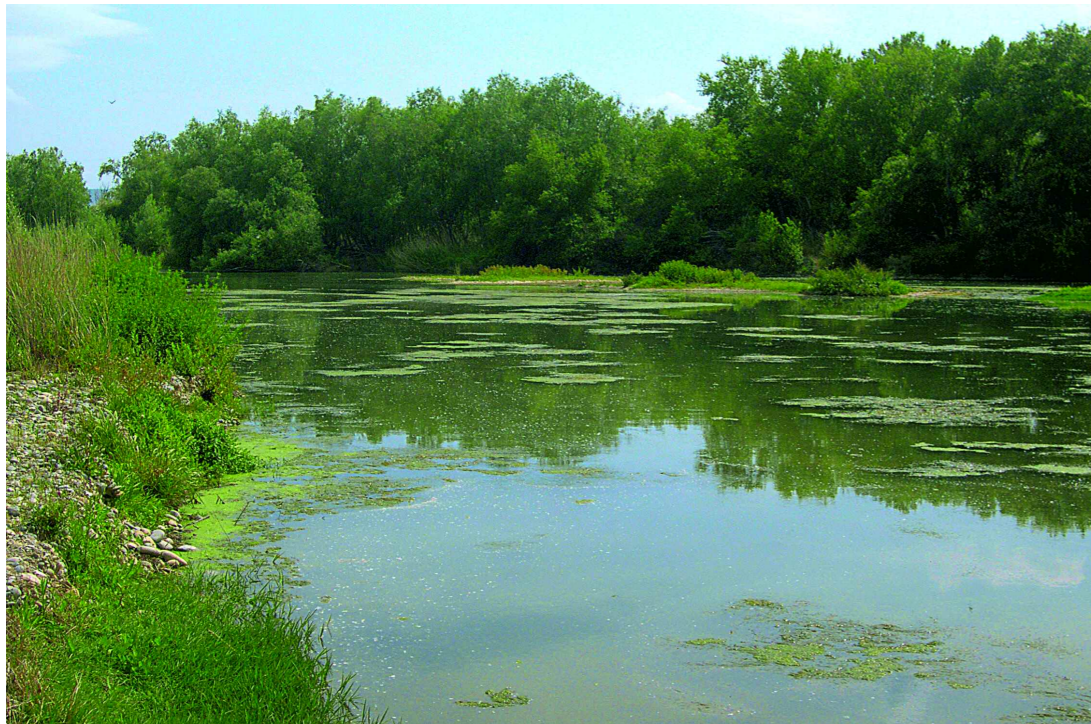
El Cinca, a Massalcoreig (Segrià). J. Carreras