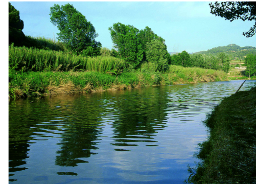
El Cardener, vora Manresa (Bages). R. Ortiz

Cursos mitjans i baixos dels rius principals, des dels Prepirineus i el territori ruscínic fins al catalanídic meridional.