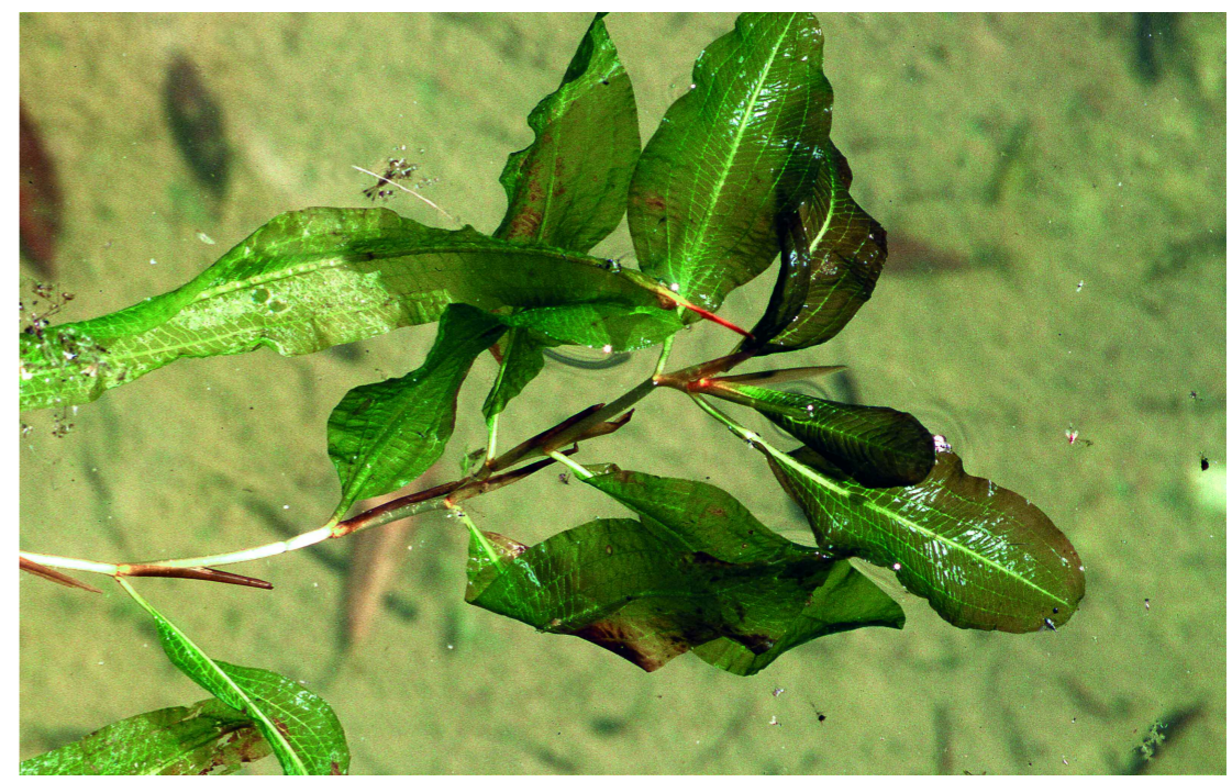
Potamogeton lucens . J.L. Benito

Territoris ruscínic i catalanídic i Pirineus centrals.