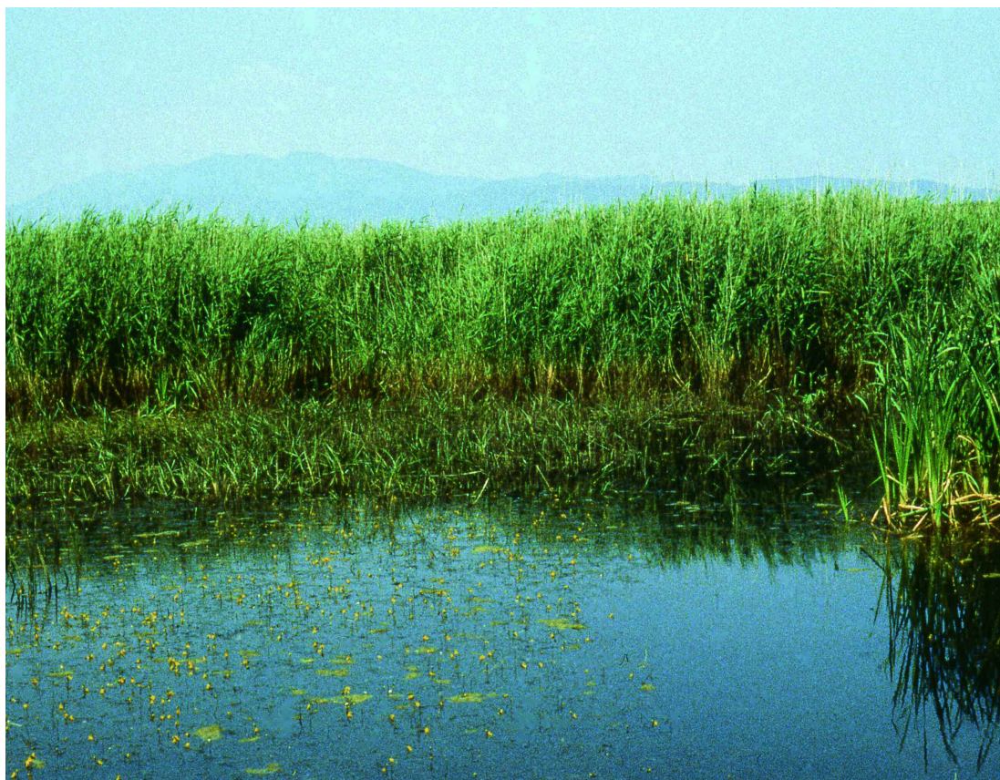
Poblament d' Utricularia australis a l'estany gros del Torlits (Alt Empordà). J. Font

Poblaments d' Utricularia vulgaris o U. australis , parcialment flotants, d'aigües dolces estagnants de terra baixa i de l'estatge montà