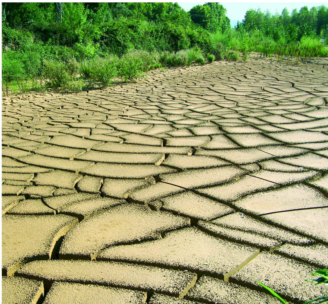
Fangar al marge de l'estany de Sils (la Selva). G. Mercadal