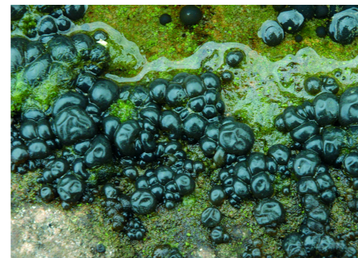
Nostoc verrucosum . A. Sánchez-Cuxart

Pirineus i territoris ruscínic, olositànic, catalanídric, ausosegàrric i sicòric.