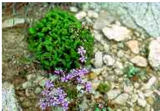
Ensopeguera ( Limonium minutum ). Unitat de Botànica, UB

Costes rocoses i abruptes, amb vegetació esparsa, limitada als petits relleixos i a les esclotxes de les roques. Les espècies que hi viuen són rupícòles i halòfiles alhora. Es tracta de petits camèfits, de fulles i tiges més o menys carnosos, sovint amb glàndules excretores de sal. També s'hi fan algunes plantes de distribució no exclusiva d'aquests ambients ( Reichardia picroides , Sonchus tenerrimus , Helichrysum stoechas ...), que aquí prenen formes particulars a causa de la salinitat.