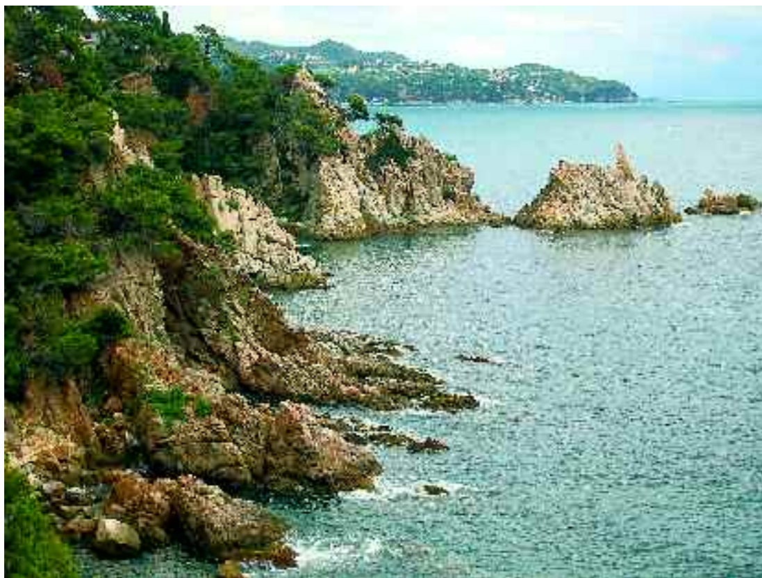
Costa de la Selva, entre Blanes i Lloret de Mar. A. Ferré