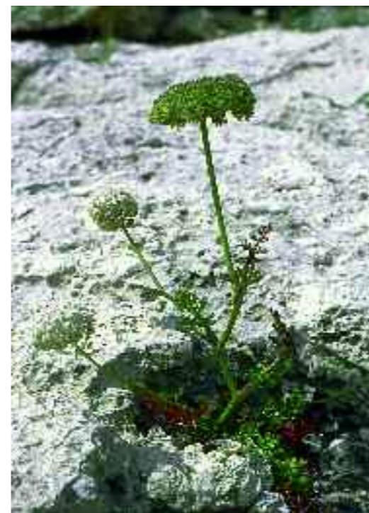
Pastanaga marina. R.M. Masalles

Territoris ruscínic i catalanídic septentrional.