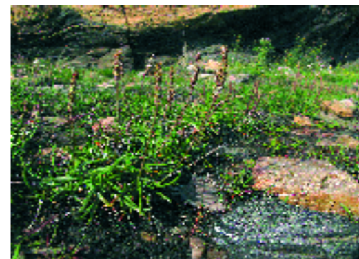
Plantatge marí. A. Petit

Llobregat, Torredembarra i delta de l'Ebre); també a les terres interiors (territori sicòric).