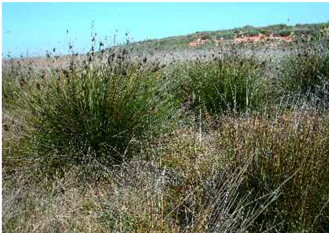
Formació amb abundància de jonc agut a Utvesa (Segrià). J.A. Conesa

Prats dominats per plantes carnoses ( Plantago crassifolia... ) o junciformes ( Schoenus nigricans, Juncus acutus... ), de sòls salins, generalment arenosos i poc humits