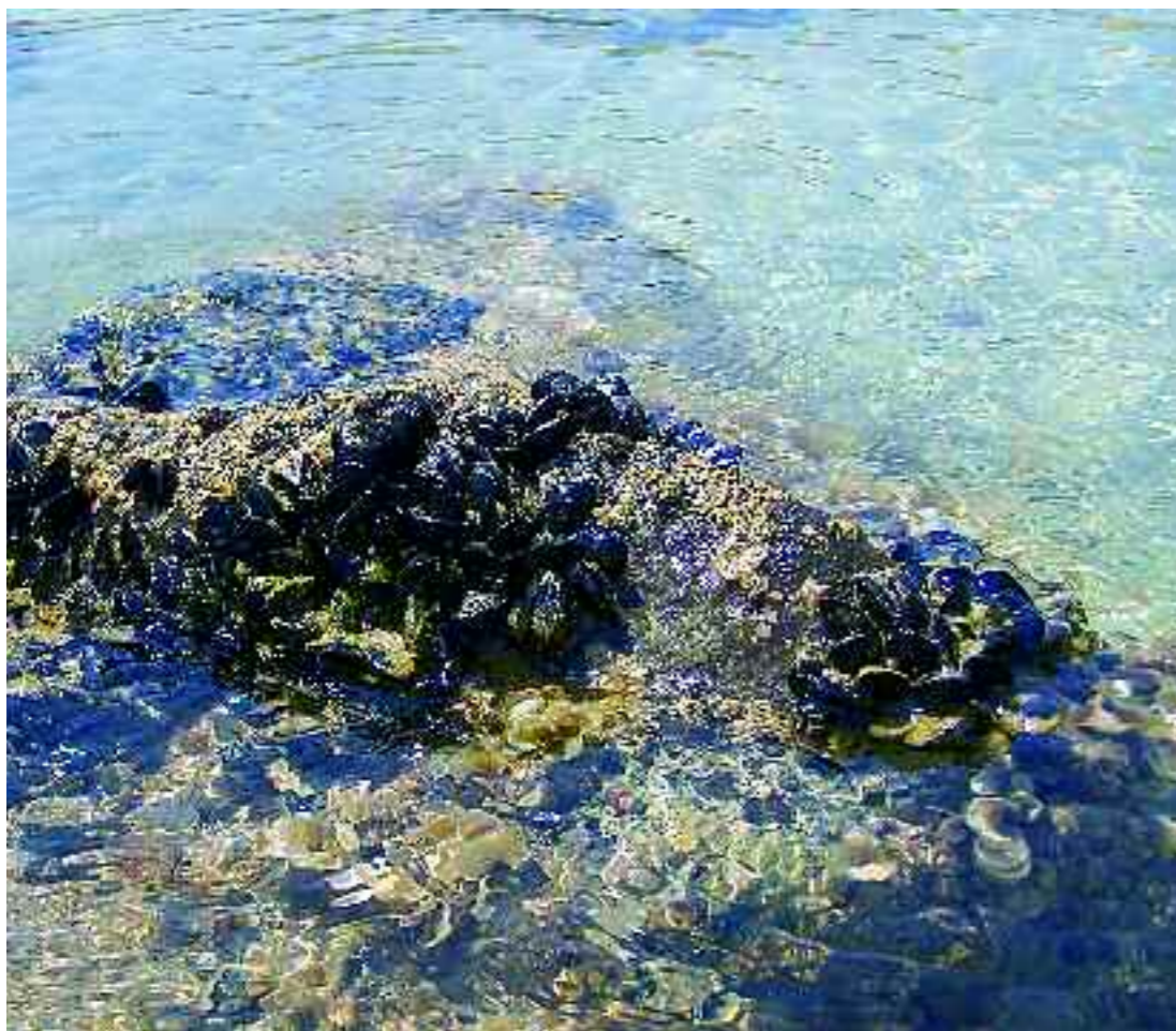
Musclera vora el cap de Creus. G. Mercadal