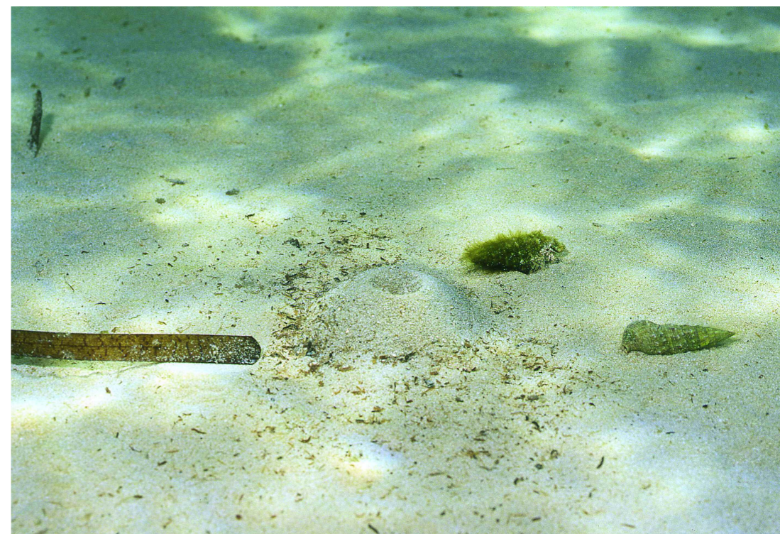
Cerithium vulgatum (pada) i una fulla de Posidonia oceanica , sobre un fons de sorra. E. Ballesteros

La construcció davant les platges de barreres protectores afavoreix la proliferació d'aquest hàbitat.