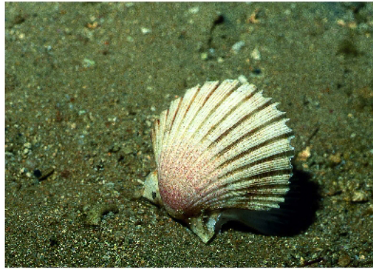
Petxina de pelegrí ( Pecten jacobaeus ). E. Ballesteros