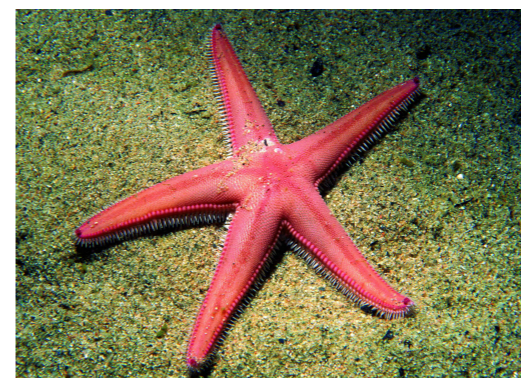
Estrella de mar ( Astropecten irregularis ).