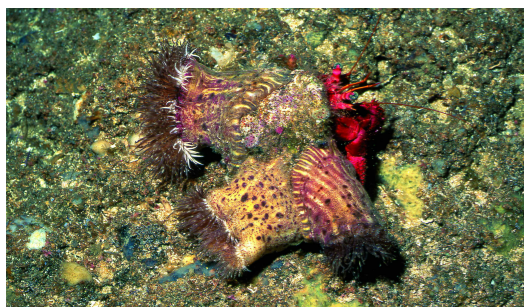
Calliactis parasitica. E. Ballesteros

Aquest hàbitat té una distribució batimètrica variable segons les zones, però a la costa catalana apareix habitualment entre (20)30 i 70(80) m. La majoria d'organismes que hi viuen són filtradors i detrítívors, bé que en algunes fàcies també poden ser comuns els herbívors (i les algues).