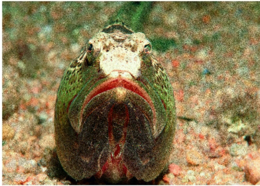
Aranya. Centre de Recursos de Biodiversitat Animal, UB