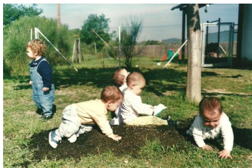
Experimentació amb sòl