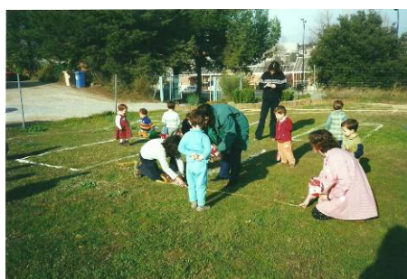
Marquem a on estarà l'hort