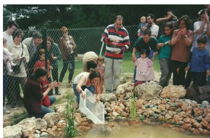
Fiquem vida a la nostra bassa!!!

A l'any 2001 l'Escola Bressol Gespa donava per acabat el seu Projecte d'Ambientalització que va integrar el bosc, l'hort i la bassa no només en la vida dels infants sinó també en el Projecte Educatiu del Centre i que va convertir el treball sobre l'entorn i la sostenibilitat en una de les línies d'escola que més l'han caracteritzat al centre al llarg d'aquest temps.