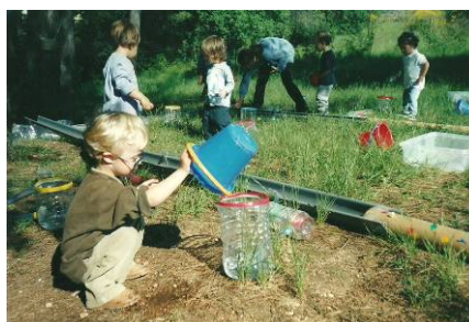
Fem circuits al bosc

Algunes de les propostes didàctiques van ser: