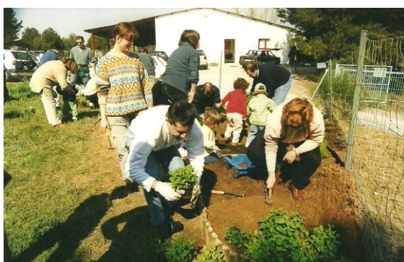
La Plantada amb les famílies

Segona Fase: Treballem la Biodiversitat a través de l'hort amb els infants i les seves famílies.