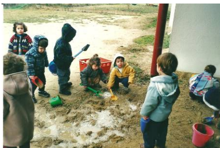
L'aigua canvia amb la terra