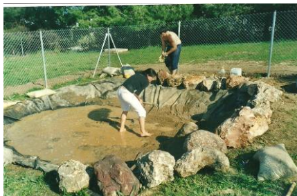
Construcció de la bassa