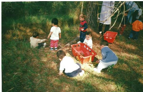
Busquem elements al bosc

activitats adaptades als diferents grups d'infants de manera que tots poguessin participar.