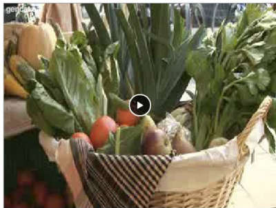
La producció agroalimentària ecològica

La producció agroalimentària ecològica és un sistema de gestió agrícola i producció d'aliments que combina les millors pràctiques ambientals, un elevat nivell de biodiversitat, la preservació de recursos naturals, l'aplicació de normes exigents de benestar animal i una producció conforme a les preferències d'un nombre creixent de consumidors interessats en productes obtinguts a partir de substàncies i mètodes naturals.