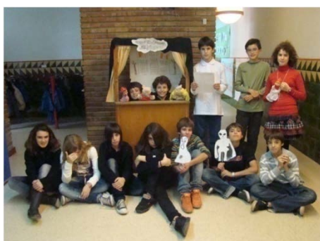
Telling Stories - Secundària