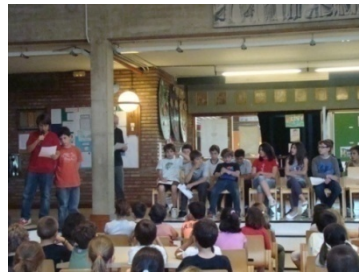
Presentació de càrrecs