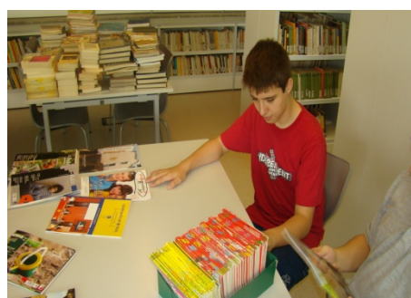
Bibliotecaris - Secundària