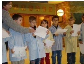
Cronistes – Primària