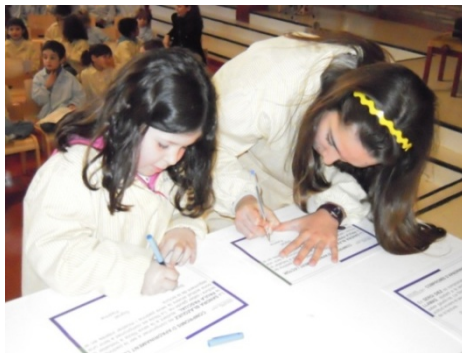
Apadrinament lector – Vida Social Infantil i Primària