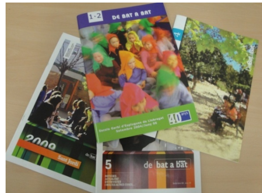
Revista "De Bat a Bat"