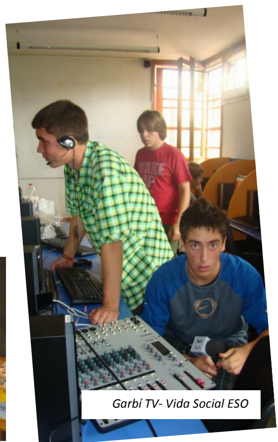
Garbí TV- Vida Social ESO