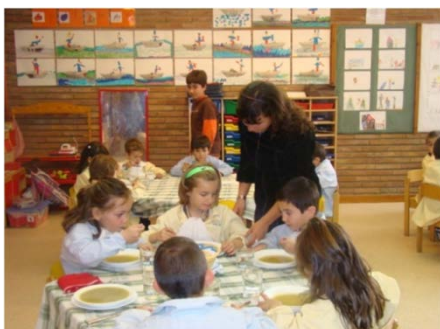
Mainaders - Secundària