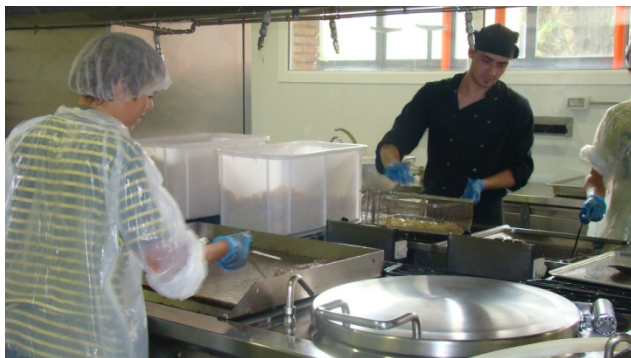
Cuina- Vida Social ESO