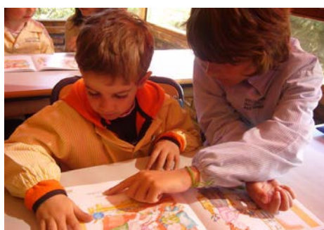
Ajudant en la lectura