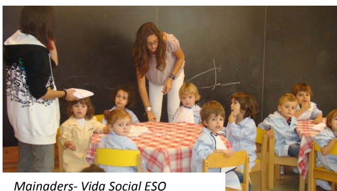
Mainaders- Vida Social ESO