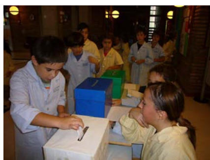
Eleccions Caps Generals de Color