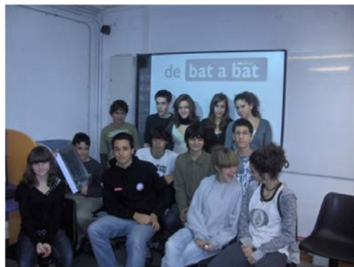
Grup de Vida Social que elabora la Revista