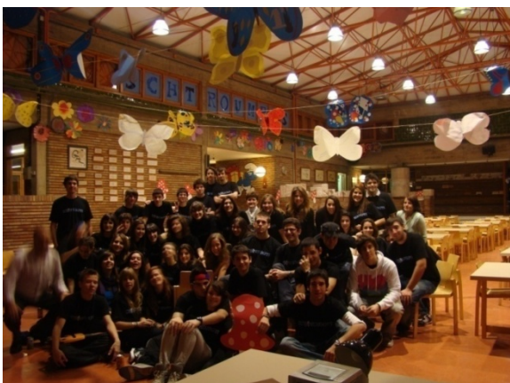
Alumnes de la Promoció de Batxillerat preparant la seva Fira

Creiem que els homes i les dones de demà educats en una escola no burocratitzada, amb un equip educatiu coherent, dins d'un ordre autènticament democràtic, contribuiran a enriquir una societat lliure.