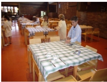
Caps de taula - Primària