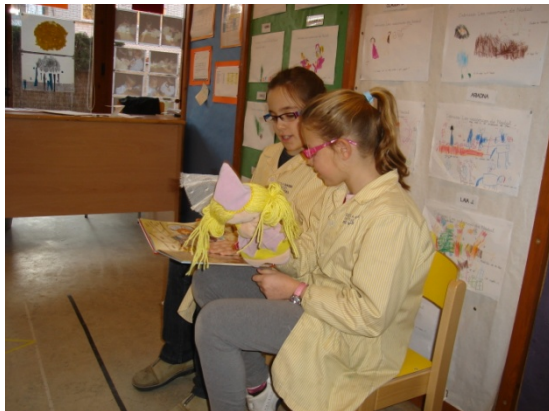
Títelles- Vida Social primària