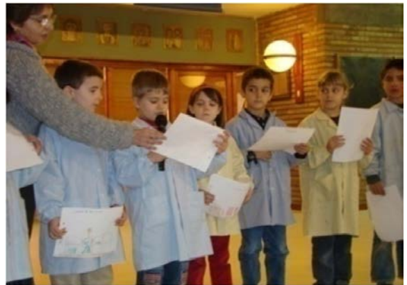
Cronistes- Vida Social primària