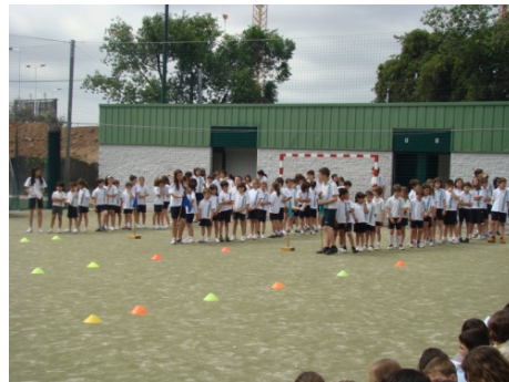
Curses de colors - Primària

Les activitats es realitzen en funció de l'edat dels nens i les nenes: Tria del color (P4), inici de la dinàmica i posterior l'ús de gomets i cartronets que a primària es substitueix per les dècimes, curses atlètiques de colors, campionats d'escacs, etc.