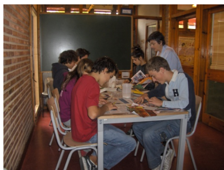
Enquadernació - Secundària