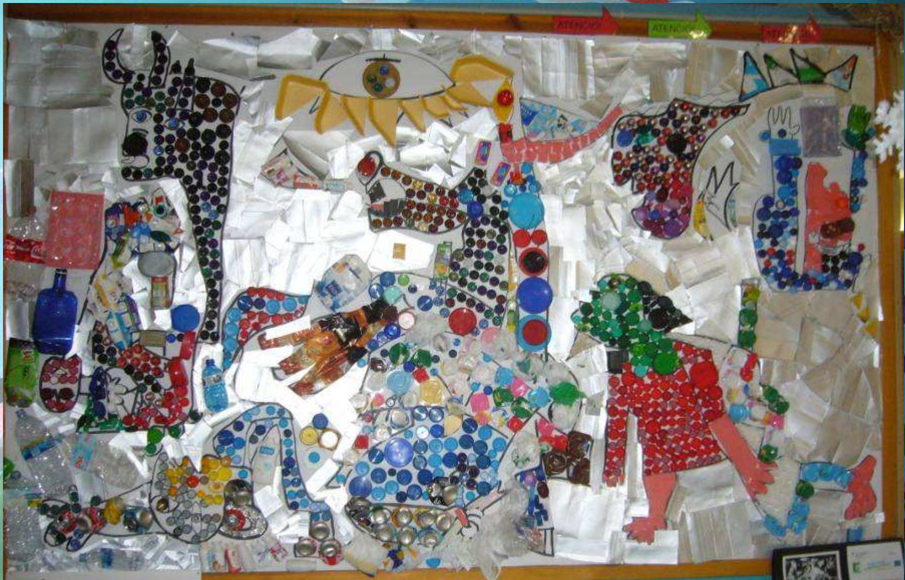
EL GUERNICA Pablo Picasso