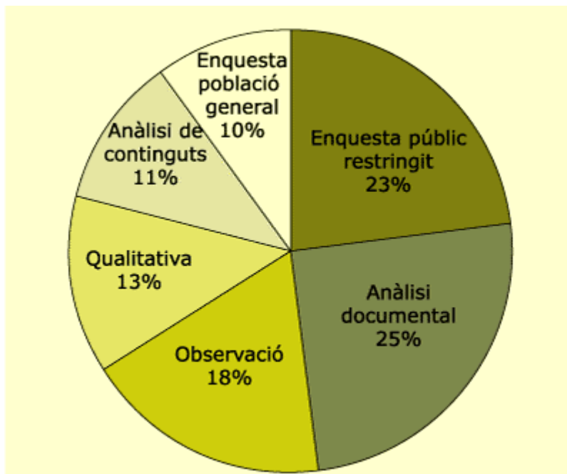
Gràfic 3. Metodologia aplicada en la recollida de la informació

Destaquen, en primer lloc, la notable importància atorgada a l'observació i el que una tercera part dels treballs hagin estat efectuats per mitjà d'enquestes. La categoria "enquestes a públic restringit" inclou els treballs fets amb entrevistes a directius d'empreses o a grups d'escolars.