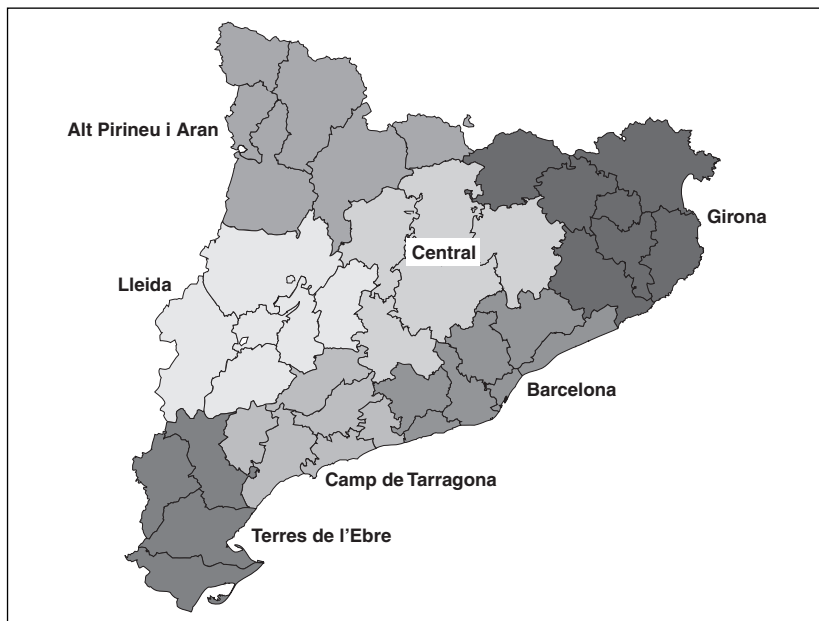
Mapa 2. Proposta de circumscripcions electorals