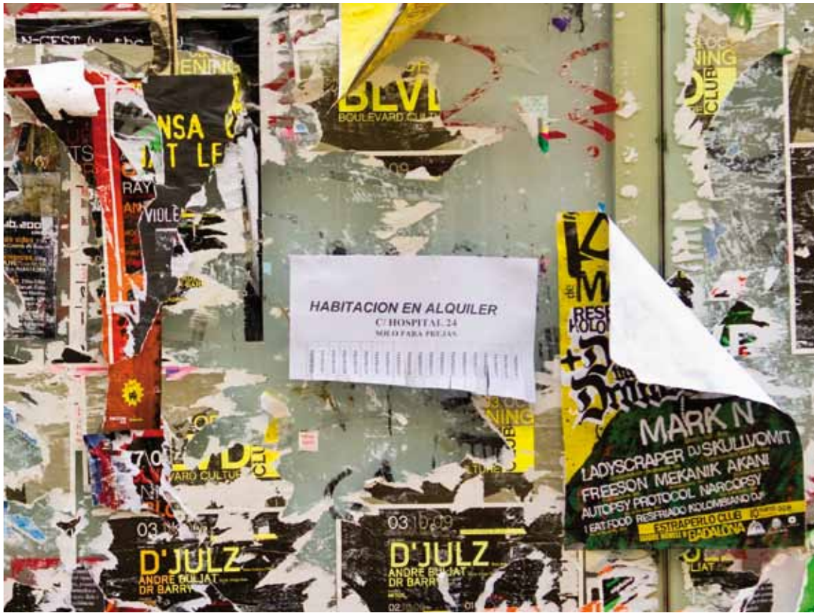
Segons dades del cens de l'INE de 2001, els immigrants ocupen habitatges en pitjors condicions d'habitabilitat que la mitjana de la població i majoritàriament en règim de lloguer

Restarà, un aspecte que no pot ser objecte d'aquest treball, avaluar en el futur com la gestió pública fa o no realitat aquests mecanismes previstos ara en el nostre ordenament.