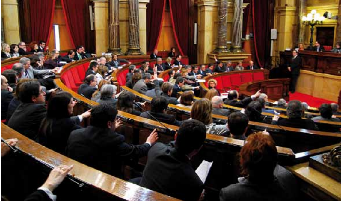
Els diputats del Parlament de Catalunya, reunits en el Ple del 24 de març de 2010, van aprovar per unanimitat la nova llei

per ser designat pel Parlament per representar Catalunya al Senat. L'article 61, però, manté, com ja feia l'Estatut de 1979, les mateixes pautes de procediment, concretament que la designació s'ha de fer en una convocatòria específica i de manera proporcional al nombre de diputats de cada grup parlamentari.