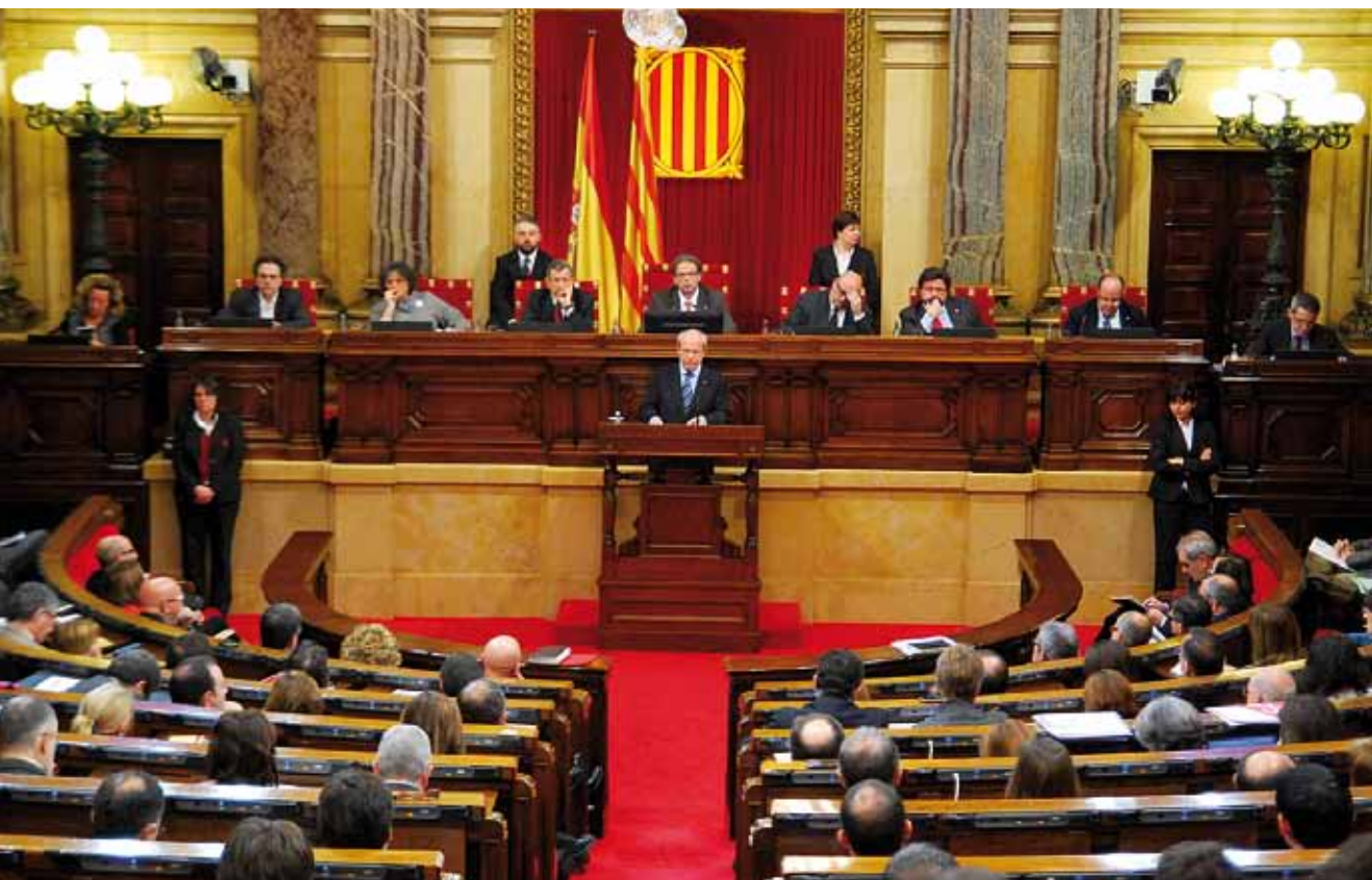
Un moment del ple del 24 de febrer, en què va tenir lloc el debat general sobre la crisi econòmica

Del conjunt d'iniciatives legislatives, destaquen especialment les iniciatives per regular diferents polítiques públiques: les polítiques de joventut de Catalunya; el cinema de Catalunya; les mesures en matèria d'ocupació pública; el règim de l'aranès, el Protectorat de fundacions i associacions d'utilitat pública, o l'impost sobre successions i donacions.