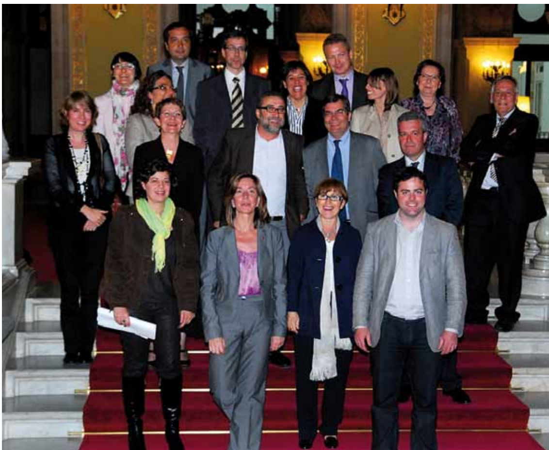
La llei es va aprovar per 70 vots a favor, 16 en contra i 46 abstencions. En finalitzar la votació, es va fer la tradicional foto de família, encapçalada per la consellera, a les escales del palau del Parlament

Tot i que des de l'any 1979 es parlava de la possibilitat que Catalunya assumís la funció inspectora, no ha estat fins ara que s'ha assolit el traspàs. Val a dir que l'Estatut de Catalunya actual preveu expressament, a diferència de l'anterior, la dependència orgànica i funcional del personal que fa tasques d'inspecció de la Generalitat de Catalunya en totes aquelles matèries de l'ordre social que ja li eren pròpies.