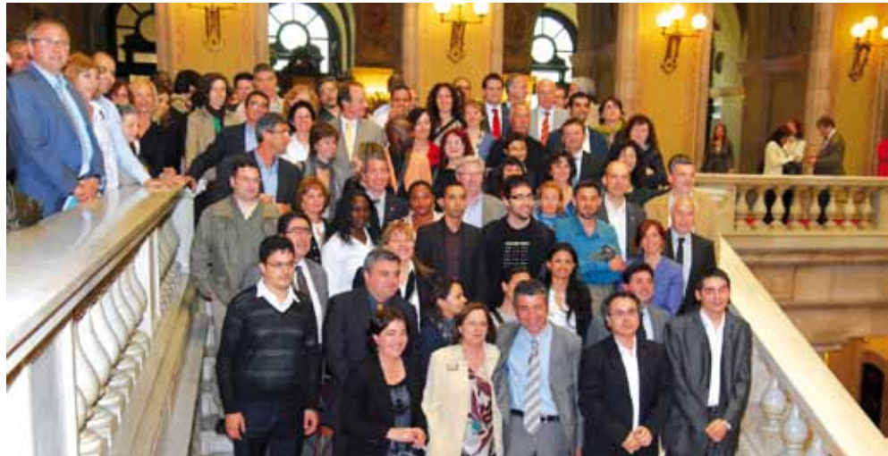
La consellera d'Acció Social i Ciutadania, Carme Capdevila, amb el secretari per a la Immigració, Oriol Amorós, diputats i membres de diverses associacions, després d'aprovar la Llei d'acollida

La política d'acollida significa un esforç comú, una inversió de futur que tant la població immigrada com la població receptora han d'estar disposades a emprendre. S'ofereix a les persones immigrades una primera oportunitat per a adquirir unes habilitats bàsiques per ser autosuficients, aconseguint que els nouvinguts siguin menys dependents dels serveis bàsics.