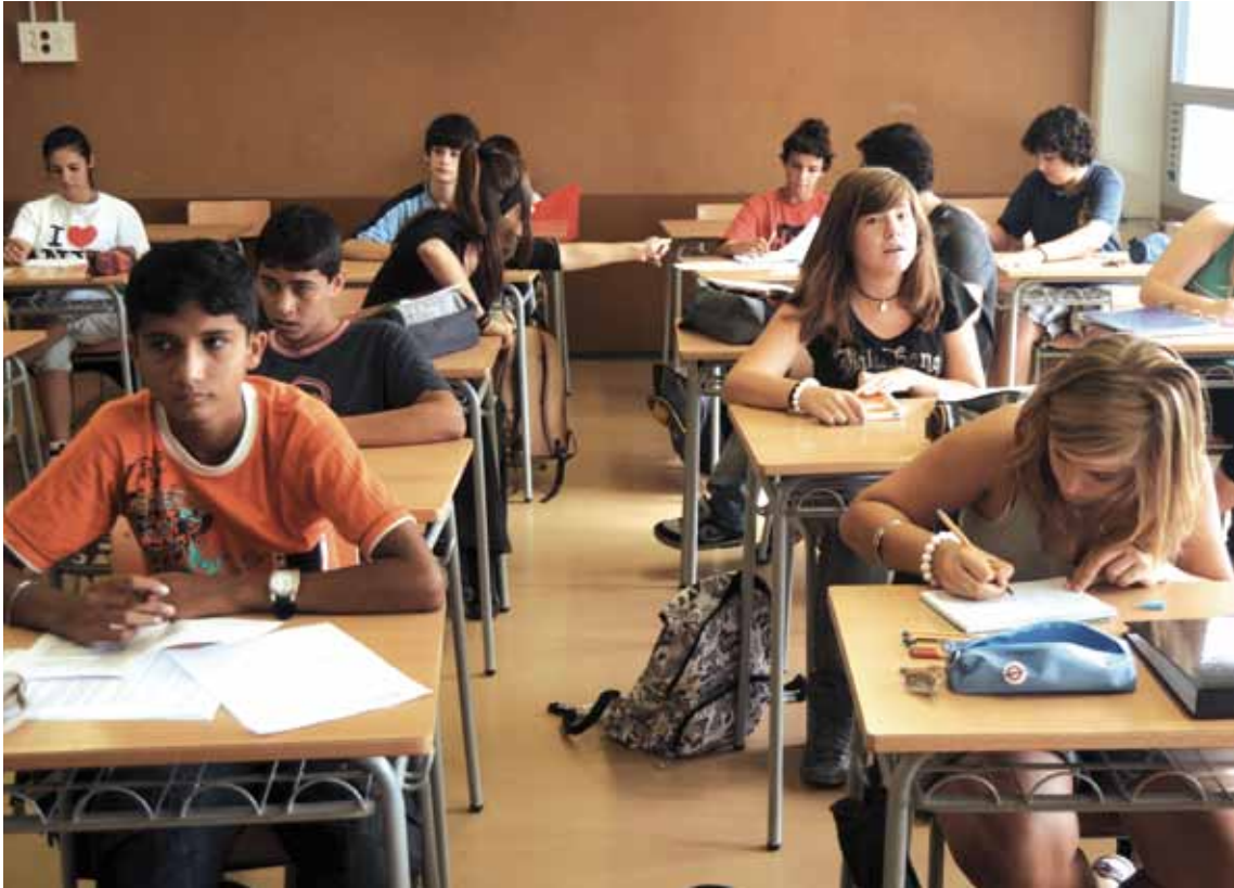
El sistema escolar a Catalunya es basa en el model de la "immersió lingüística", que estableix la llengua catalana com a llengua vehicular, sens perjudici que es garanteixi l'ensenyament de les dues llengües cooficials

Tal com s'ha posat de relleu es produeix una estreta relació entre la segregació urbana de la població immigrant i la segregació escolar 7 . L'existència de guetos urbans, entesa com a zones o barris amb alta concentració de població immigrant, propicia l'existència de guetos escolars. És des d'aquest sentit que hi ha una estreta relació entre l'urbanisme i l'educació, per la qual cosa caldrà contemplar aquest fenomen des d'una perspectiva àmplia i transversal, en la qual estaran implicades diverses competències, com poden ser entre d'altres les relatives a urbanisme, educació, acollida i convivència ciutadana.