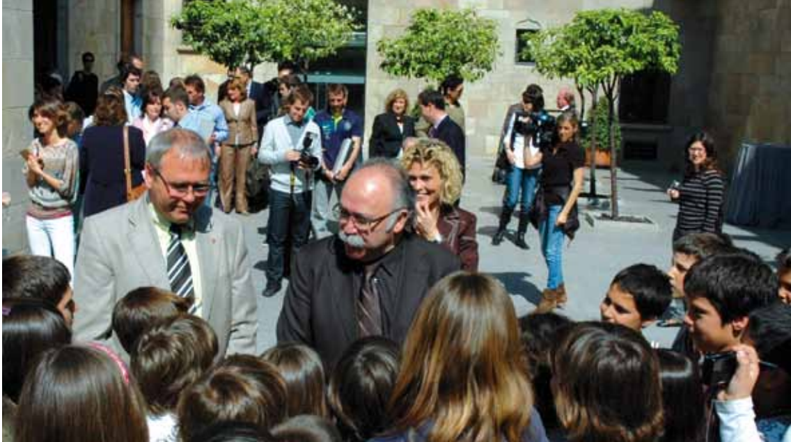
El vicepresident del Govern i el director general de Relacions Institucionals amb els alumnes de l'escola Torrent d'en Melis de Barcelona durant la seva visita al Palau de la Generalitat, el passat 26 d'abril