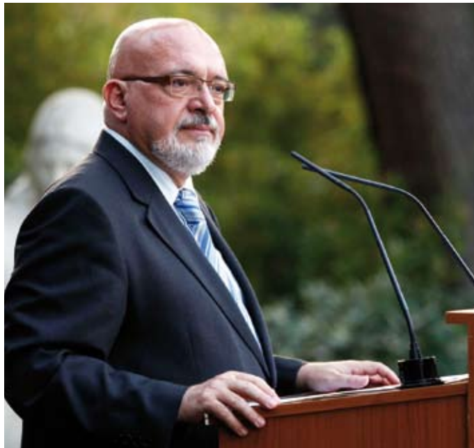
El conseller d'Innovació, Universitats i Empresa, Josep Huguet.

Des del punt de vista estructural, la indústria catalana es pot descriure com fonamentalment transformadora, diversificada, lleugera, flexible i constituïda principalment per petites i mitjanes empreses i, com passa en la resta d'economies desenvolupades, es troba plenament afectada pels intensos processos de globalització, el canvi tecnològic i la transformació sectorial des d'activitats industrials tradicionals cap a nous sectors emergents i de serveis relacionats amb la producció, més intensius en coneixement i de més valor afegit. Davant d'aquests canvis estructurals, i en la mesura que la indústria és el sector capdavanter en la innovació tecnològica, la internacionalització, la racionalització de