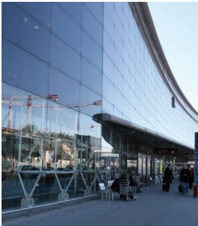
Aquesta nova Llei deroga les dues lleis vigents anteriors, d'aeroports i heliports respectivament.