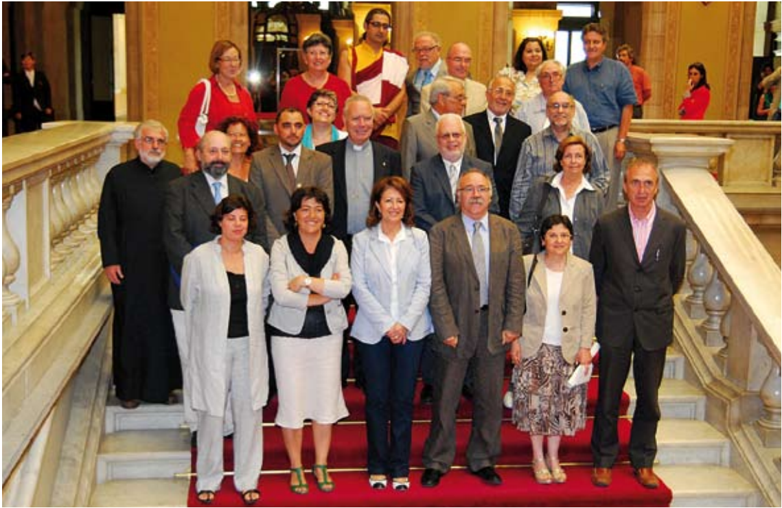
El vicepresident del Govern amb els ponents de la Llei de culte i membres de diferents confessions religioses.

La Llei ha estat elaborada tenint en compte tots els sectors implicats. Durant el tràmit d'audiència per a l'elaboració de l'Avantprojecte de Llei, el Govern va consultar totes les confessions religioses amb presència significativa a Catalunya, així com la Federació de Municipis de Catalunya, l'Associació Catalana de Municipis i Comarques i la Lliga per la Laïcitat. Totes les propostes i els suggeriments a l'articulat van ser presos en consideració. Cal destacar la receptivitat i la capacitat de diàleg dels membres de la ponència parlamentària davant les compareixences al Parlament. Ho demostren les seves esmenes al Projecte de Llei aprovat pel Govern, que, lluny de desvirtuar-lo, en van deixar més clars els continguts essencials i les finalitats.