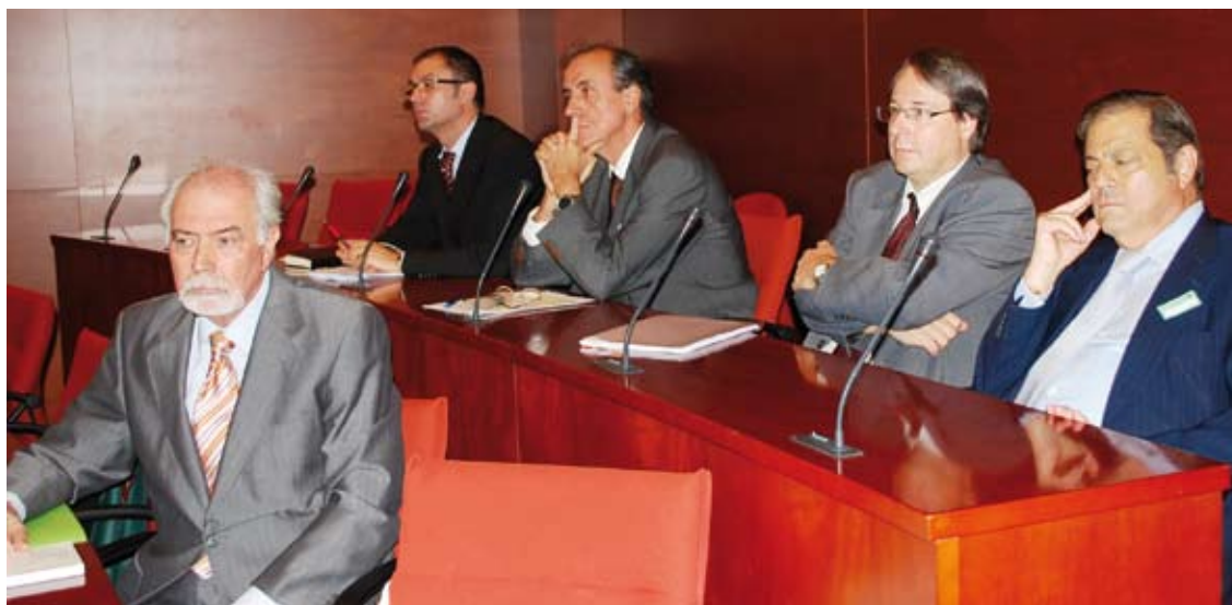
Cinc dels sis membres del Consell de Garanties Estatutàries proposats pel Parlament en la compareixença davant la Comissió d'Afers Institucionals, el 13 de juliol, que va avaluar la seva idoneïtat per al càrrec.

Igualment, s'han aprovat altres lleis, que han de servir per completar la renovació del sistema institucional del país. És el cas de la Llei del Consell de Garanties Estatutàries, aprovada el 4 de febrer, que reemplaçarà el Consell Consultiu en la funció de vetllar per l'adequació de les lleis i disposicions de la Generalitat a l'Estatut i a la Constitució, a les quals se sumen noves funcions.