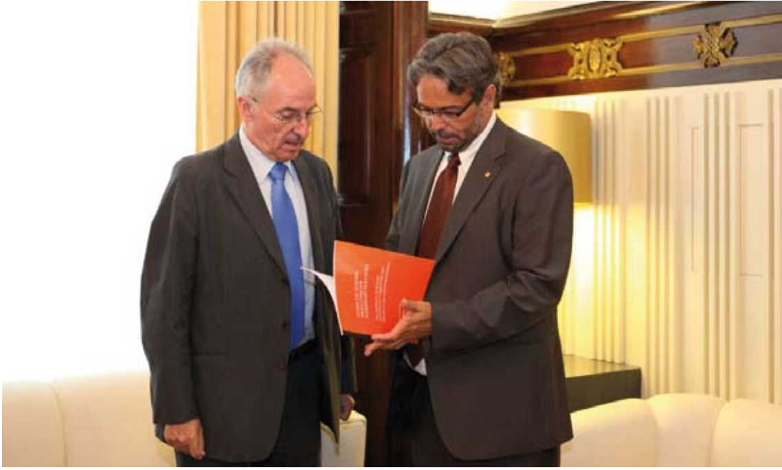
El codi recull 17 principis per promoure un elevat nivell de prestació dels serveis públics als ciutadans.