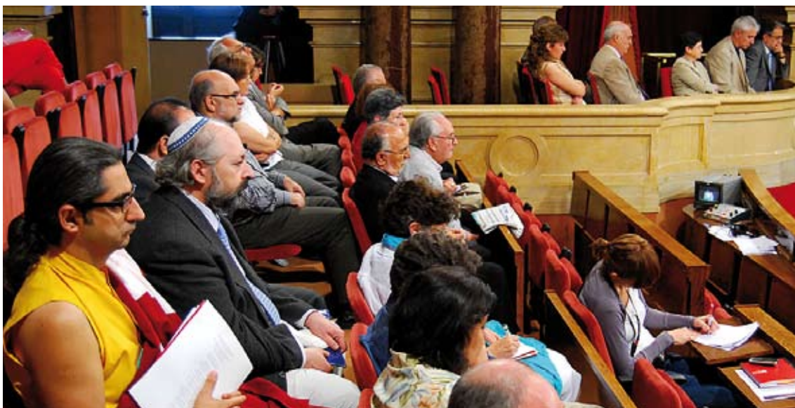
Membres de diferents confessions religioses seguint el debat.

Els objectius principals de la Llei són: facilitar l'exercici del dret fonamental de llibertat religiosa; establir unes mesures mínimes de seguretat i de salubritat dels centres perquè no causin molèsties a terceres persones; donar suport jurídic als ajuntaments, i unificar els requisits tècnics exigibles a un centre de culte.