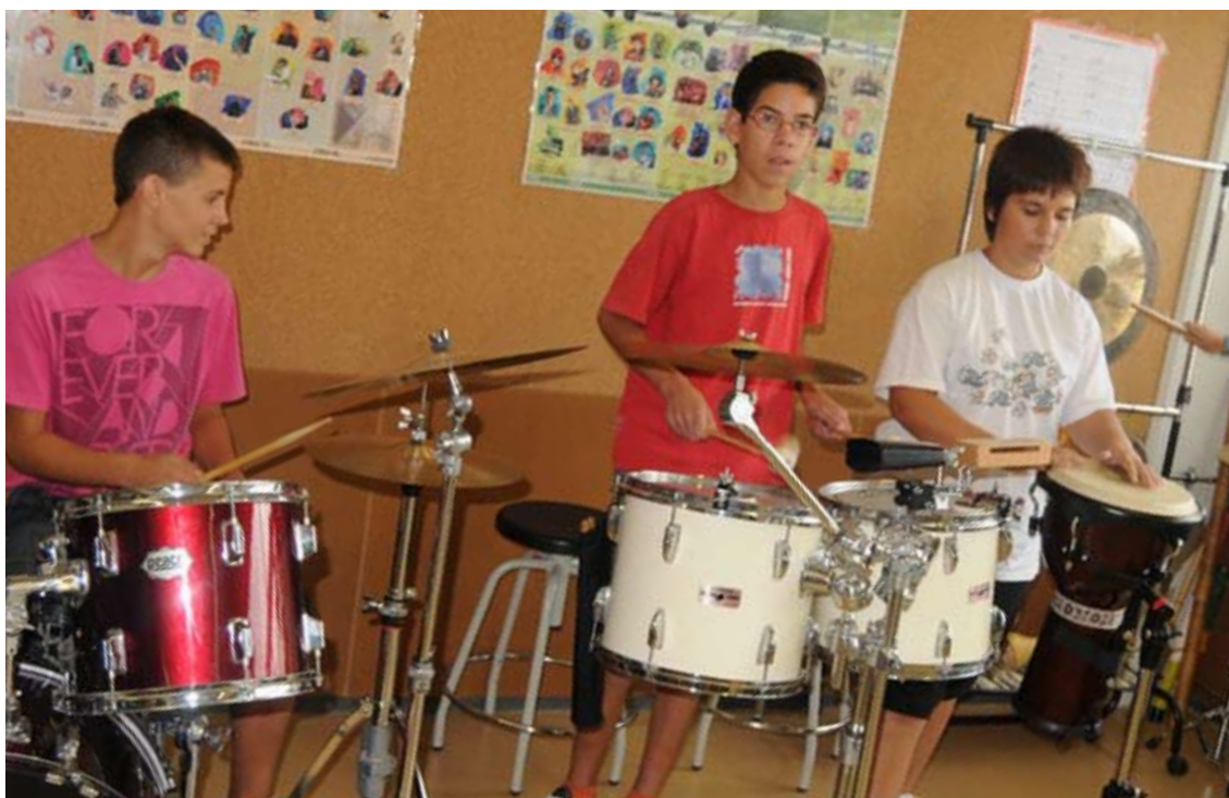
Al títol tercer de la LEC s'enumeren els drets i els deures dels membres dels diversos sectors de la comunitat educativa, entre els quals hi ha el dret de rebre una educació integral i de qualitat.

El títol tercer de la LEC es refereix a la comunitat educativa i la comunitat escolar, que és aquella part de la comunitat educativa que, vinculada de manera permanent i directa a cada centre, és representada en el seu consell escolar als centres sostinguts amb fons públics. S'estableix (article 20) la carta de compromís educatiu per facilitar la coherència entre l'educació en l'àmbit familiar i l'educació escolar; s'enumeren els drets i els deures dels membres dels diversos sectors de la comunitat educativa, entre els quals hi ha el deure de l'alumnat a estudiar i assistir a classe, i el dret que té a rebre una educació integral i de qualitat, com a protagonista que és del procés educatiu. També en aquest títol hi ha preceptes sobre l'associacionisme d'alumnes i de famílies, sobre els principis generals de participació dels sectors de la comunitat escolar en la vida del centre i, molt específicament, sobre els aspectes que s'han regulat per llei en matèria de convivència escolar. El títol finalitza amb unes previsions, innovadores en la mesura que no són tradicionals en les lleis educatives espanyoles, sobre l'educació en el lleure.