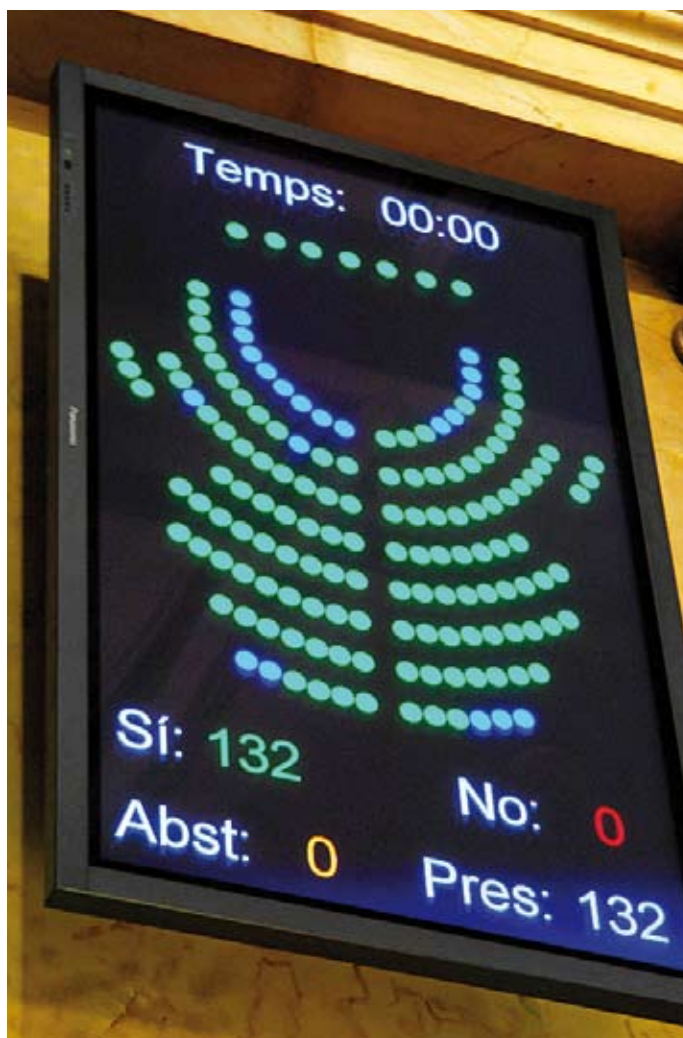
La Llei de mediació, que es va aprovar per unanimitat, s'insereix en el corrent europeu d'actualitzar les lleis de mediació.

Ambdós decrets legislatius, en tant que disposicions normatives amb força de llei que dicta el Govern, han entrat en vigor l'endemà de publicar-se en el DOGC.