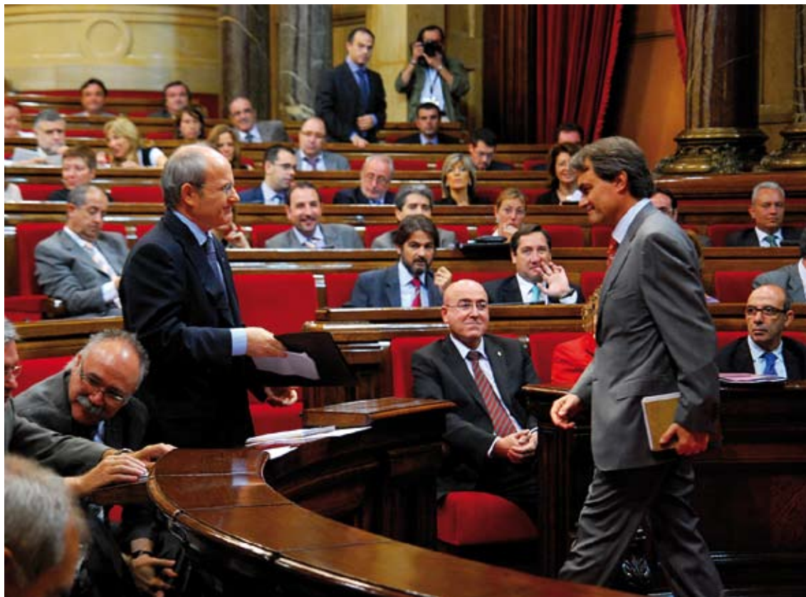
En el Ple monogràfic sobre finançament, de 24 de juliol, la cambra va donar suport al nou model perquè desenvolupa l'Estatut en la seva potencialitat.

Atesa l'actual situació econòmica –i amb l'objectiu que no es posi en risc la cohesió social i que la crisi no generi més desigualtats– la cambra també demana al Govern que prioritzi, durant aquesta legislatura, determinats objectius, com: l'ampliació dels plans de formació per a les persones aturades; l'impuls dels plans locals anticrisi; l'ampliació de la política de lloguer d'habitatges; les mesures de suport financer a les empreses (especialment les PIME); la cobertura de les beques de menjador; el reforçament del conjunt de prestacions socials, i el desplegament previst de la Llei estatal de la dependència, i de la cartera de serveis socials de Catalunya.