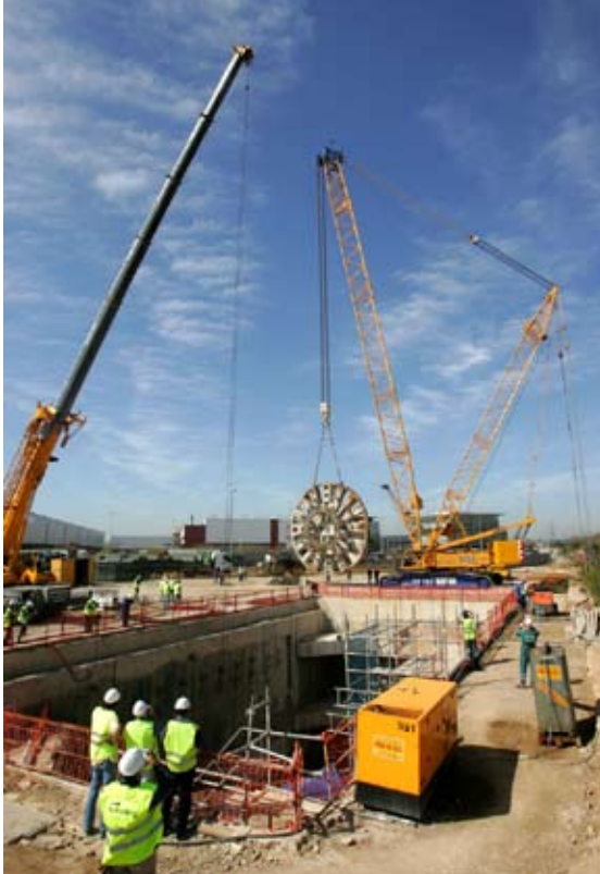
Tuneladora de l'L-9.