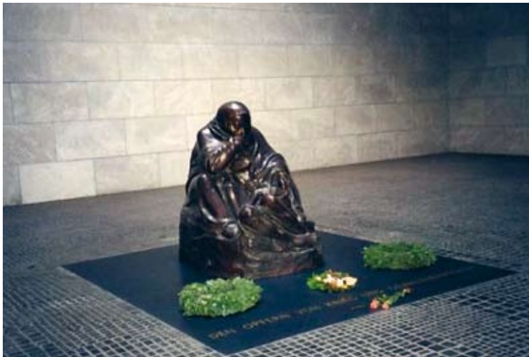
Mare amb fill mort, a la Neue Wache de Berlín. Monument a les víctimes de les guerres i les tiranies.

El Museu Jueu de Berlín (2001-2005) respon a aquesta concepció gegantina i acumulativa. Està ubicat en un edifici de nova planta que representa una estrella de David trencada.