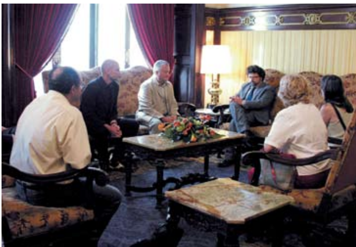
Representants dels supervivents de Mauthausen van visitar el Parlament de Catalunya el 15 de juny de 2007.

Considerem que aquestes precisions han estat ben encertades, atès que un sistema democràtic no pot fer distincions entre les víctimes de la violència i d'uns procediments judicials i administratius injustos. Un país democràtic no pot diferenciar les víctimes a causa