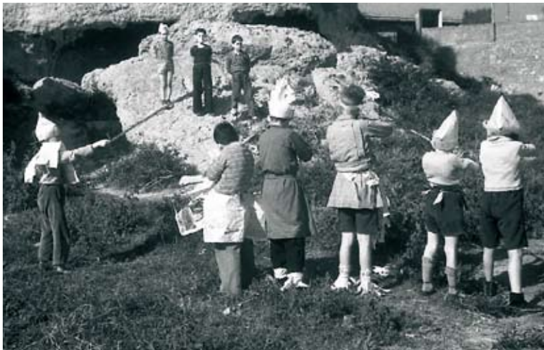
Nens jugant a la guerra a la rereguarda.

El Departament d'Educació distribuirà 2.000 llibres-CD a tots els instituts d'ensenyament secundari de Catalunya i posarà aquest recurs a disposició dels mestres en els Centres de Recursos Educatius. Amb aquest llibre, la Direcció General de la Memòria Democràtica obre la col·lecció Eines de Memòria , destinada a facilitar recursos a les escoles per promoure la recuperació de la memòria democràtica.