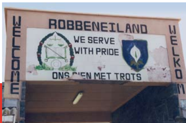
La presó-illa de Robben Island, situada dotze quilòmetres davant la costa de Ciutat del Cap, on Nelson Mandela va estar reclòs entre 1964 i 1982.

Un altre lloc de la memòria que he triat en aquest itinerari per Sud-àfrica no és un espai concret, sinó la gravació de les compareixences públiques de les víctimes i els seus repressors davant la Comissió per la Veritat i la Reconciliació. És així com les víctimes, més enllà d'una reconciliació eventual o un perdó improbable, han vist reintegrar la seva expe-