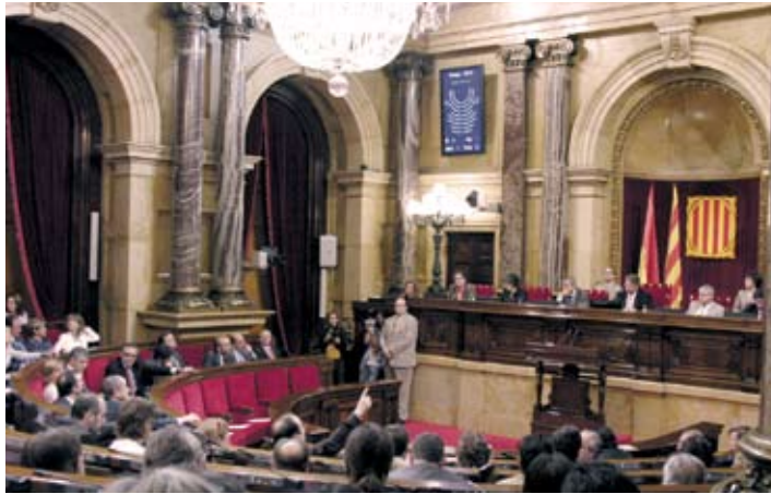
Vista d'una sessió plenària del segon període de sessions.