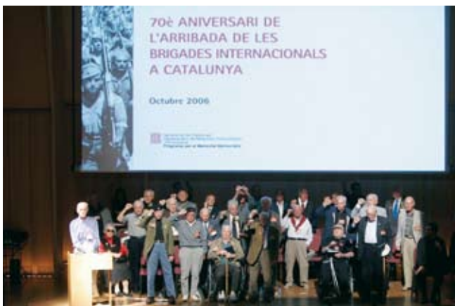
Acte de commemoració del 70è aniversari de l'arribada de les Brigades Internacionals a Catalunya, que va tenir lloc a Barcelona l'11 d'octubre de 2006.

Per tant, com a element commemoratiu, cal que el Memorial Democràtic incideixi en l'espai públic amb una funció dual: d'una banda ha d'erigir la seva seu –tant si és un edifici històric emblemàtic com si és de nova planta– com a fita visible i permanent dels valors que proclama, i per aquest motiu seran de gran importància tant la conceptualització de la seva exposició estable com la de l'edifici, restaurat o nou. En segon lloc ha d'oferir-se com espai privilegiat per acollir els actes socials, culturals i institucionals de la memòria democràtica (celebracions, homenatges, festes, etc.). I és mitjançant la seva programació cultural i de participació que fomentarà el marcatge de l'espai públic d'arreu de Catalunya que cal distingir (senyalitzacions, preservació i interpretació dels llocs de memòria).