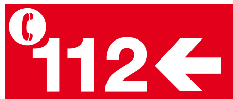
Logotip del Telèfon d'Emergències 112.

A més, l'Estatut d'autonomia de Catalunya ja preveu diferents títols competencials que atribueixen a la Generalitat l'atenció i la gestió de les situacions d'urgència i d'emergència, com ara la seguretat pública, l'organització de la policia de la Generalitat – Mossos