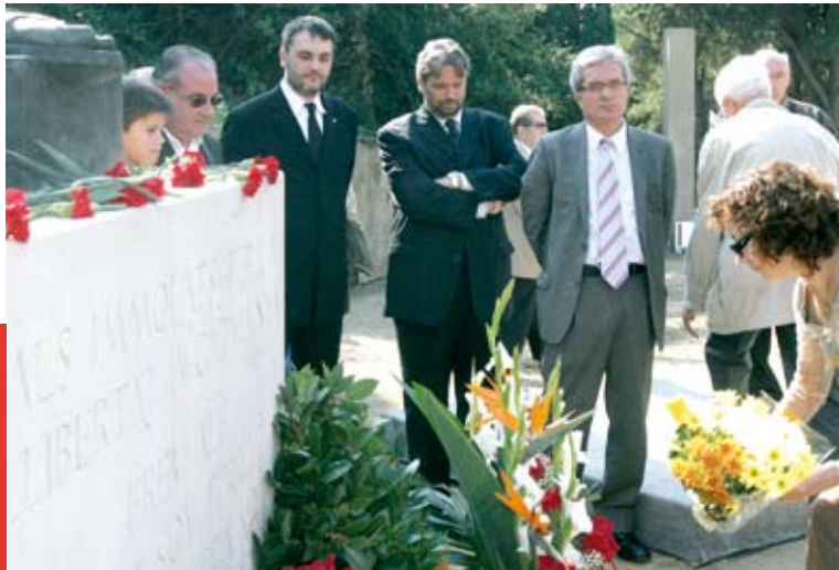
El conseller d'Interior, Relacions Institucionals i Participació, Joan Saura, en l'ofrena floral davant la tomba del president Lluís Companys al Fossar de la Pedrera el 15 d'octubre de 2006.