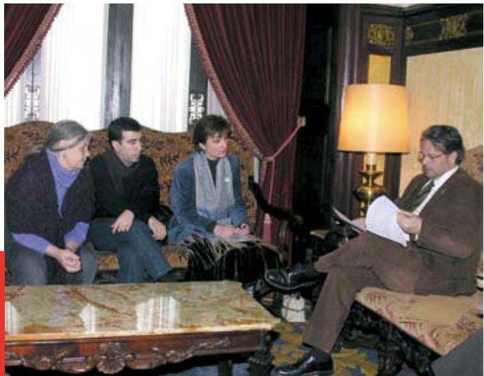
El president del Parlament va rebre els promotors de la iniciativa legislativa popular sobre la fibromiàlgia i la síndrome de fatiga crònica l'11 d'abril de 2007.

Finalment, interessa recordar que en les legislatures anteriors, amb la Llei de la ILP de l'any 1995, a Catalunya només es van presentar sis iniciatives legislatives populars. Van ser per a la creació d'un servei psiquiàtric d'urgències a domicili, sobre la Llei del joc, sobre habitatge protegit per a joves, per a les seleccions esportives catalanes, per a la prohibició de la incineració i per a la creació de places de llars d'infants. D'aquestes iniciatives només van prosperar tres lleis: la Llei 9/1999, de 30 de juliol, de suport a les seleccions catalanes; la Llei 11/2000, de 13 de novembre, reguladora de la incineració de residus a Catalunya, i la Llei 5/2004, de 9 de juliol, de creació de llars d'infants de qualitat.