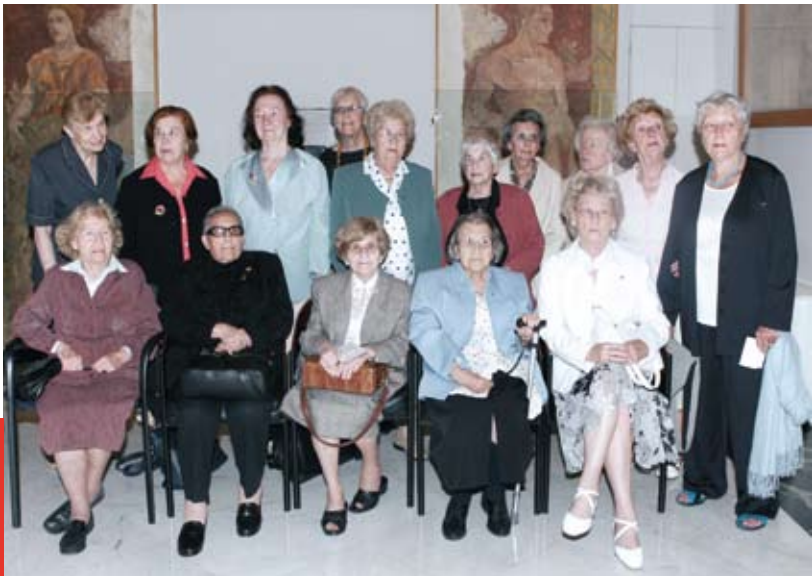
Trobada del Comitè Internacional de Ravensbrück a Barcelona el mes de maig de 2007.

Em defineixo com a catalanista i comunista, sóc com era quan era jove. Tinc aquells sentiments, no els he deixat i no veig per què els hauria de deixar. Em defineixo com una