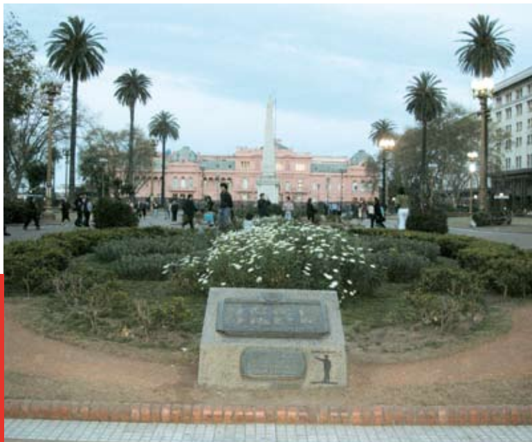
Les Madres y Abuelas de Plaza de Mayo (1977) és una de les organitzacions de drets humans de l'Argentina que integren l'Instituto Espacio para la Memoria, creat l'any 2002.

La clau de volta del treball de memòria a l'Argentina es basteix i s'impulsa per la via judicial. De la tríada "memòria, veritat i justícia", és l'exigència de no deixar impunes els crims comesos pel terrorisme d'Estat el que dóna sentit i coherència a tot el procés memorialístic.