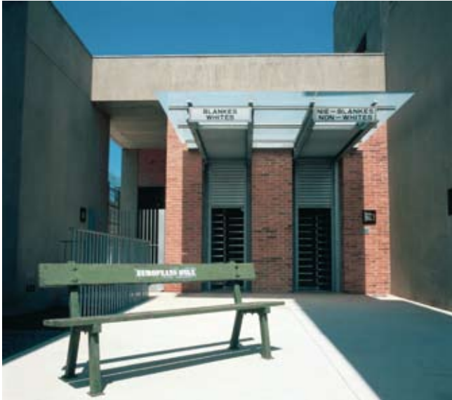
Museu de l'Apartheid de Sud Àfrica.