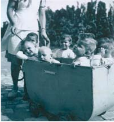
Imatge d'alguns dels nens nascuts a la Maternitat d'Elna durant els anys 1939 i 1944. La Maternitat d'Elna, bressol dels exiliats (2005).