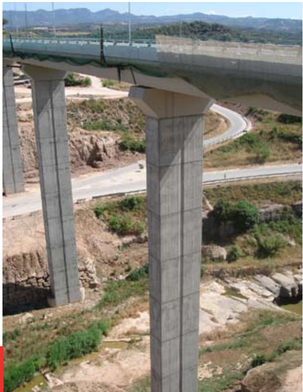
L'Eix del Llobregat.

Principis relatius al procés de contractació: el principi de la transparència i la publicitat de tot el procés de contractació i la informació de les adjudicacions dels contractes als adjudicataris i a les empreses i als professionals que presenten ofertes, amb respecte a la legislació sobre la protecció de dades.