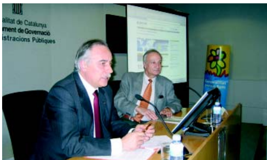
Presentació de l'acord amb Televisió de Catalunya

El Govern de la Generalitat i la Corporació Catalana de Ràdio i Televisió (CCRTV) han arribat a un acord per facilitar que els catalans que viuen fora del país puguin veure la programació de Televisió de Catalunya per Internet. És una forma de fer arribar l'actualitat de Catalunya a qualsevol racó del món, així com una eina de projecció exterior de Catalunya.