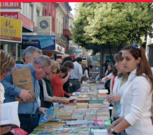
Parada de llibres a Rosario