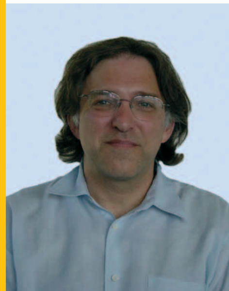
Antoni Montserrat és responsable en Sistemes d'Informació sobre la Salut a la Comissió Europea

«Cal un reconeixement mediàtic dels casals a Catalunya»