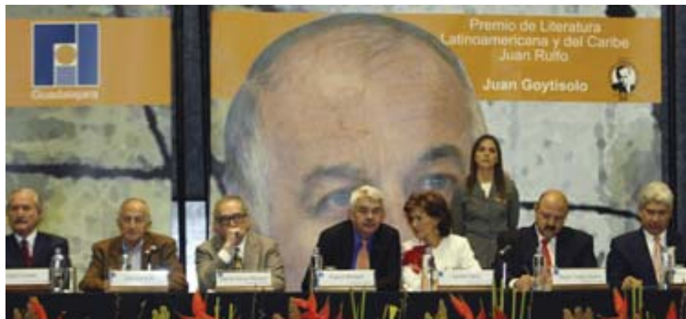
Acte inaugural de la Fira Internacional del Llibre de Guadalajara