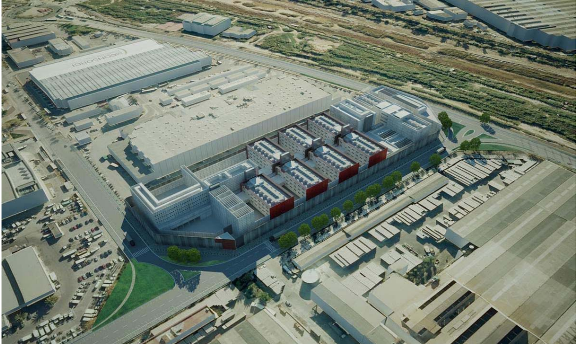
Imatge virtual del futur Centre Penitenciari de Preventius de Barcelona